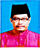
Pengarah Bahagian Pendidikan Islam Kementerian Pelajaran Malaysia

Assalamualaikum warahmatullahi wabarakatuh.