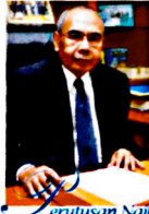
erutusan Naib Canselor Bismillahirrahmannirahim

Assalamu'alaikum warahmatullahi wabarakatuh dan Salam Sejahtera,