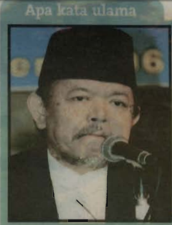
Apa kata ulama