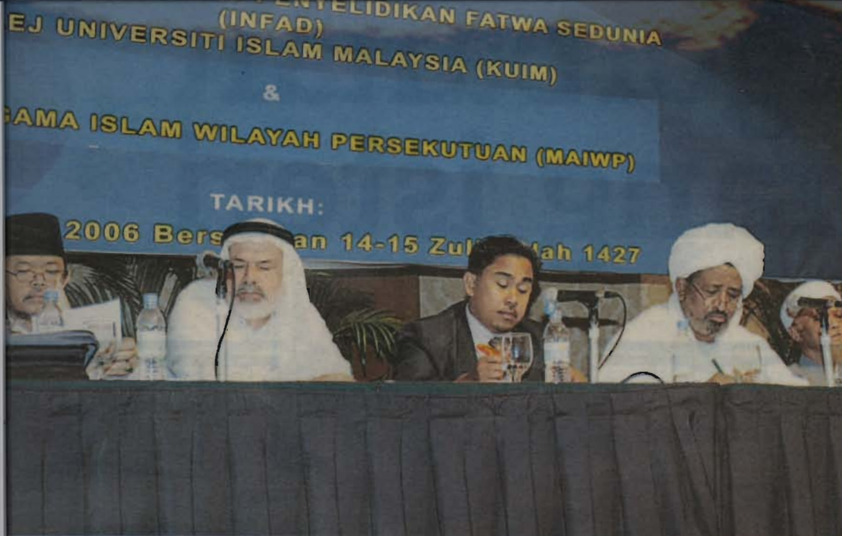
Sebahagian daripada tokoh ulama yang membentangkan kertas kerja pada seminar Manhaj Pengeluaran Fatwa Peringkat Kebangsaan di Kuala Lumpur, baru-baru ini.

“Islam adalah agama terbuka untuk semua manusia dan setiap pernyataan hukum serta fatwanya mestilah yang relevan dengan tuntutan semasa ummah.”