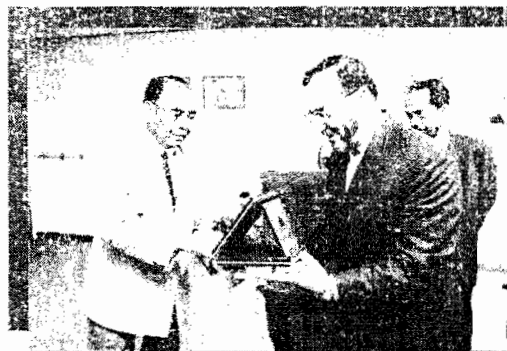
Majlis Perasmian Bulan Membaca Julai 2003 di Perpustakaan KUIM, Menara A, MPAJ