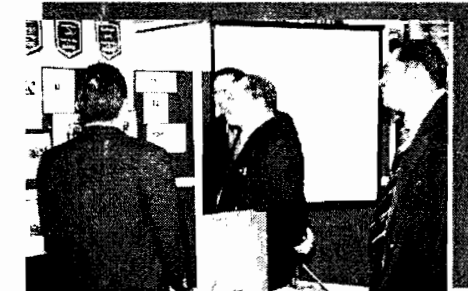
Konvensyen Kebangsaan Pertama Pendidikan Kejuruteraan Pendekatan Berorientasikan Profesyen di Hotel Marriott, Putrajaya

Diterbitkan oleh Pejabat Perhubungan Awam KUIM Tel: 03-42892094/2157 Faks: 03-42892153 E-mail: fazira@admin.kuim.edu.my