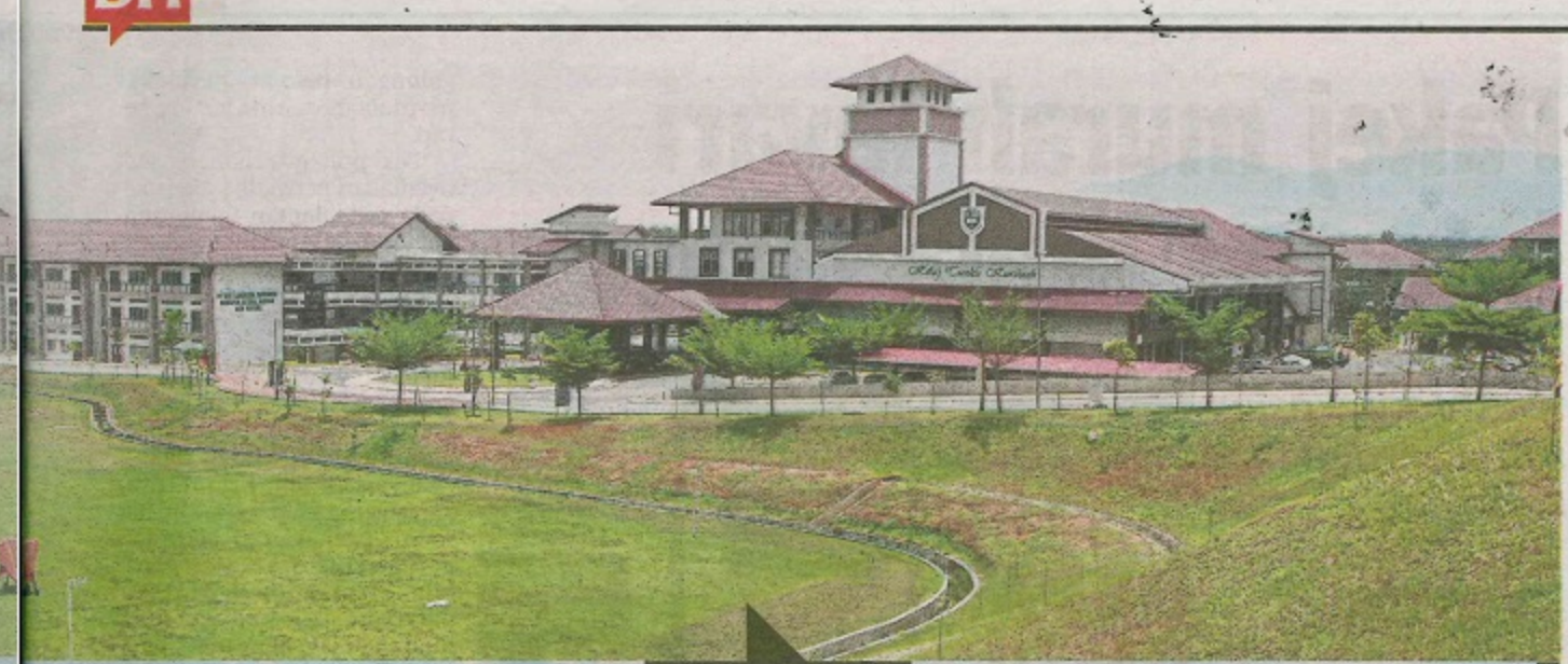
Gambar sekitar Pusat Pendidikan di Enstek, Nilai.