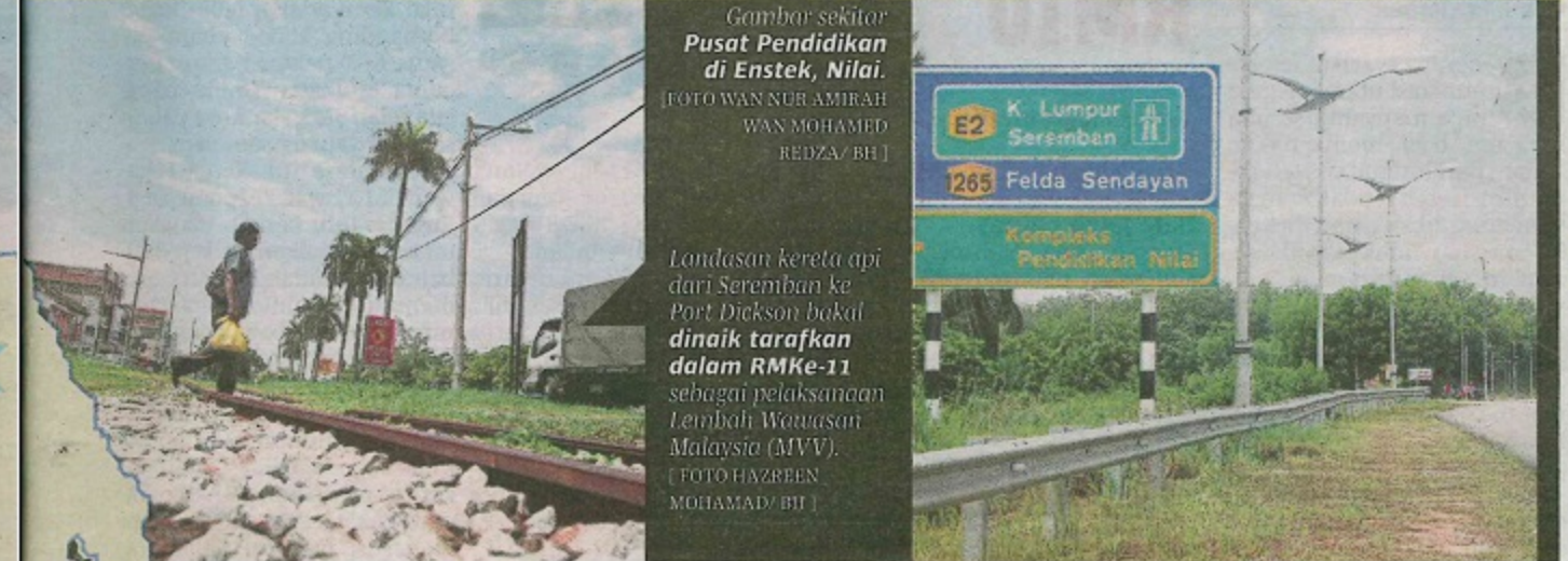
Landasan kereta api dari Seremban ke Port Dickson bakal dinaik tarafkan dalam RMKe-11 sebagai pelaksanaan Lembah Wawasan Malaysia (MVV).