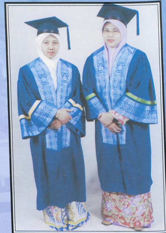
Kanan : Jubah Graduan Fakulti Pengajian Quran dan Sunnah Right : Robe for Faculty of Quranic and Sunnah Studies Graduates جبة الخريجين لكلية دراسات القرآن والسنة: يمين