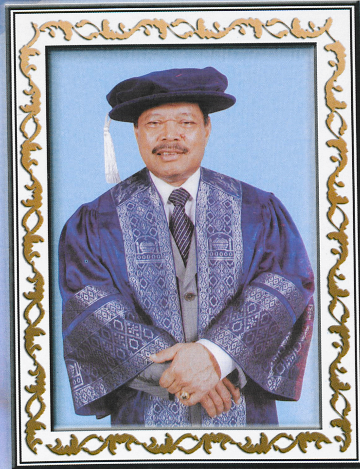
صاحب المعالي تان سري داتوء سري موسى بن محمد YANG BERHORMAT TAN SRI DATO' SERI MUSA BIN MOHAMAD PSM, DPSM, DMPN, JSM, PKT. B.Pharm (S'pore), MSc (London), DSc Hon (USM)