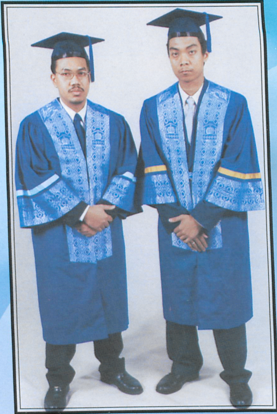
Kiri : Jubah Graduan Fakulti Ekonomi dan Muamalat Left : Robe for Faculty of Economics and Muamalat Graduates جبة الخريجين لكلية الإقتصاد والمعاملات: يسار