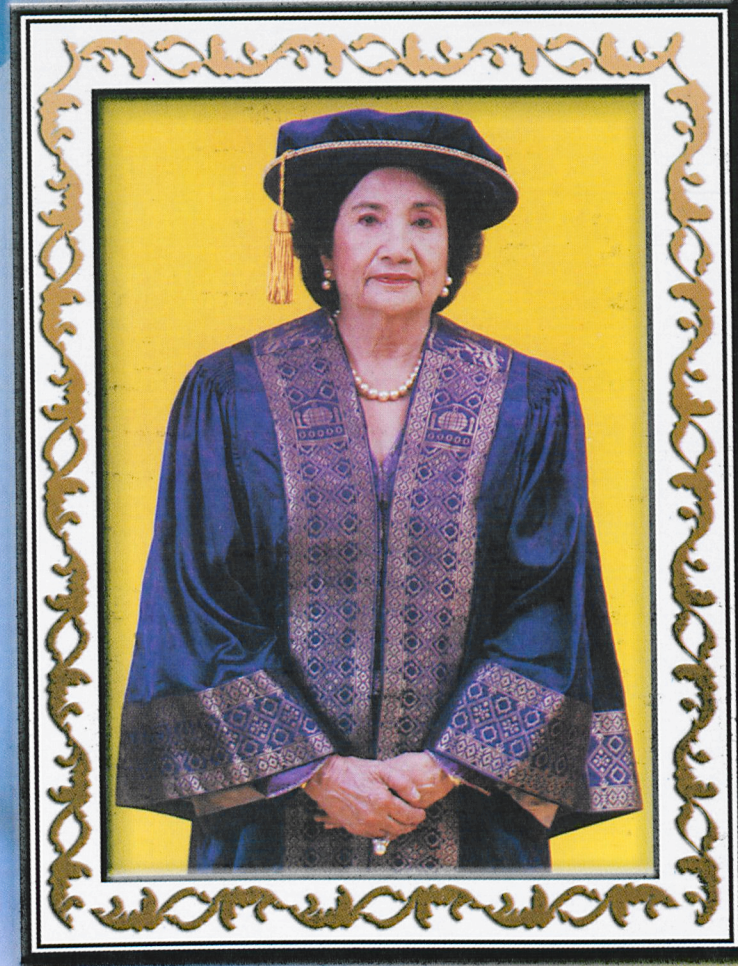
صاحبة الجلالة الملكة نجيها بنت المرحوم تنكو بسر برهان الدين DULI YANG MAHA MULIA TUANKU NAJIHAH BINTI ALMARHUM TUNKU BESAR BURHANUDDIN. D.K.N.S, D.M.N., D.K. (Kedah), D.K. (Kelantan) S.P.T.J., S.P.M.K. Tunku Ampuan Negeri Sembilan