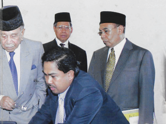
YANG DiPertuan Besar Negeri Sembilan, Tuanku Jaafar Tuanku Abdul Rahman sedang mendengar taklimat daripada salah seorang pegawai INFAD.