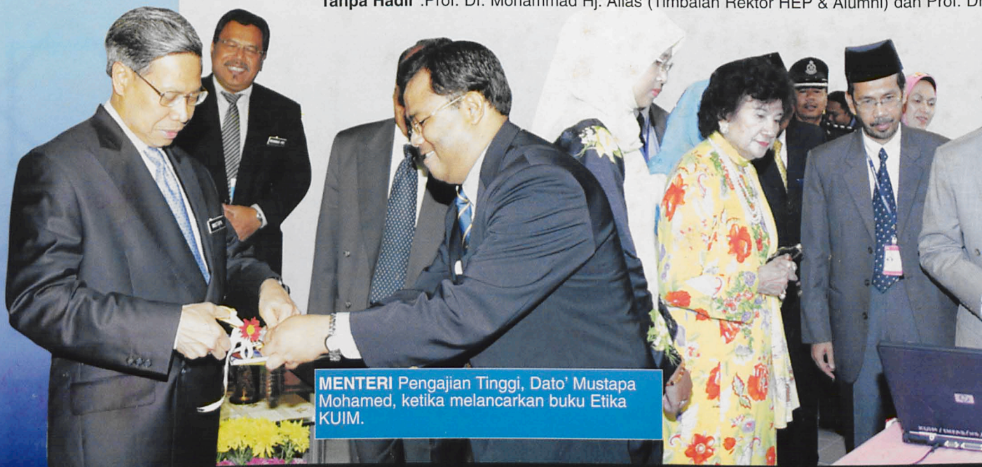
MENTERI Pengajian Tinggi, Dato' Mustapa Mohamed, ketika melancarkan buku Etika KUIM.