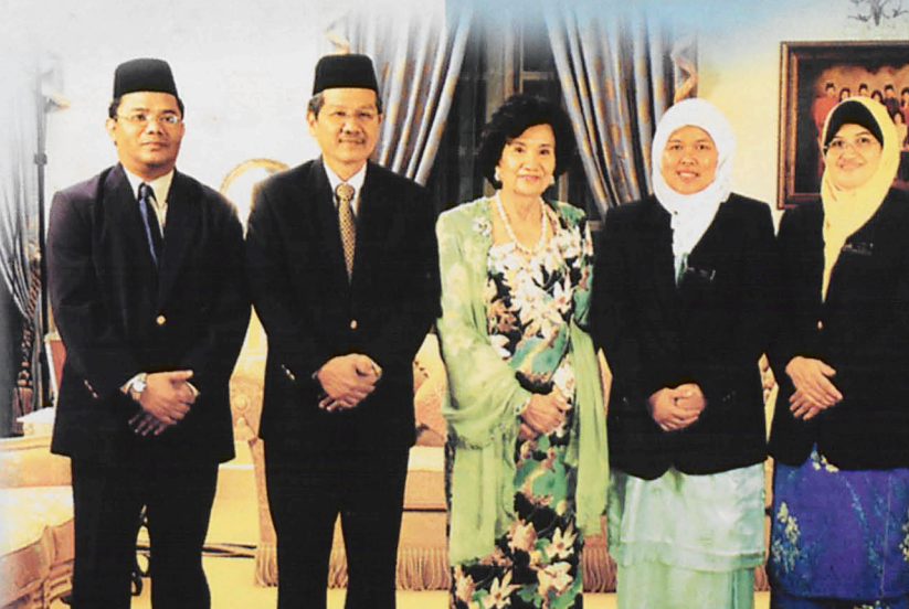
TUANIKU Canselor menerima kunjungan hormat daripada pegawai kanan universiti.