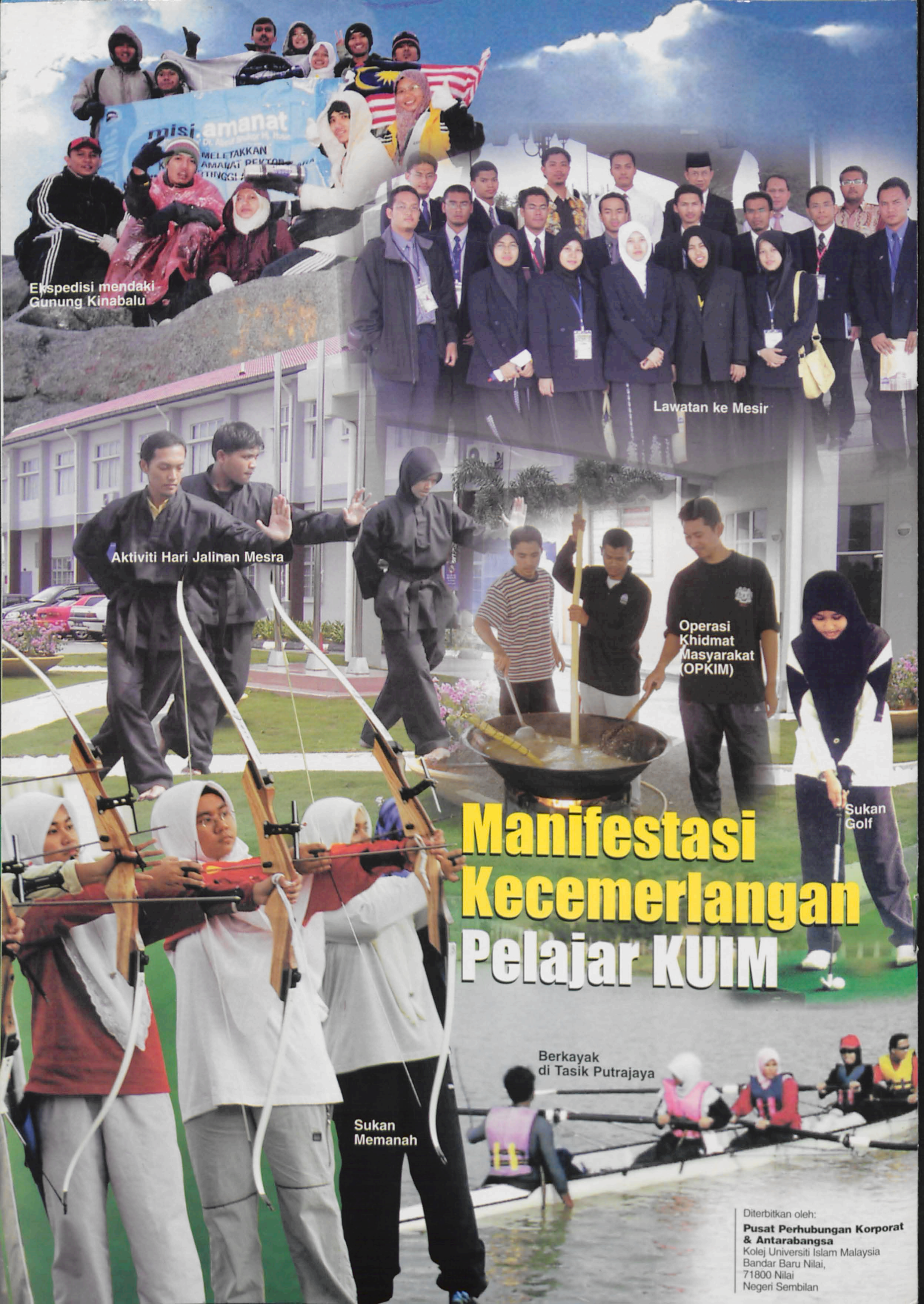
Ekspedisi mendaki Gunung Kinabalu