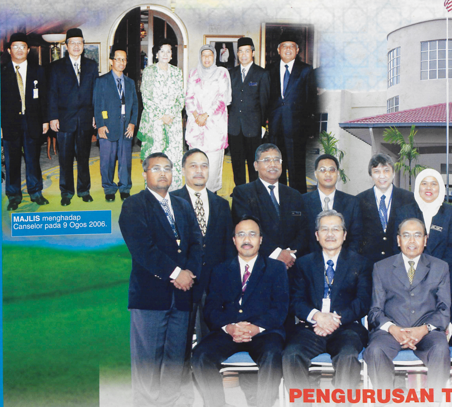
MAJLIS menghadap Canselor pada 9 Ogos 2006.