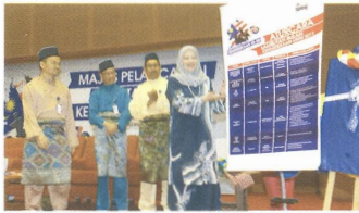
▶ Pelancaran aktiviti sepanjang Bulan Kemerdekaan peringkat USIM