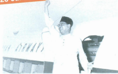
YTM Tunku yang mengetuai Rombongan Kemerdekaan tiba di Lapangan Terbang Batu Berendam, Melaka dengan Malayan Air