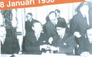
YTM Tunku dan Lennox Boyd (Setiausaha Tanah Jajahan Inggeris) menandatangani Perjanjian Merdeka di London.