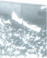
orang yang sebilangan ada ahli-ahli UMNO Rombongan Pelabuhan ngapura.

Keratan Akhbar Utusan Melayu, Rombongan Kemerdekaan yang dikuasai oleh YTM Tunku sedang berbincang di Lancaster House.