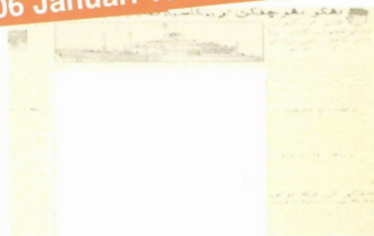
Keratan Akhbar Melayu, 6 Januari 1956 yang menunjukkan kapal laut M.V. Asia ke Karachi, Pakistan.

Rombongan Merdeka yang diketuai oleh YTM Tunku Abdul Rahman disambut oleh lebih kurang 1,000 jawatankuasa penyambut daripada Parti Perikatan semasa tiba di Lapangan Terbang Batu Berendam, Melaka.