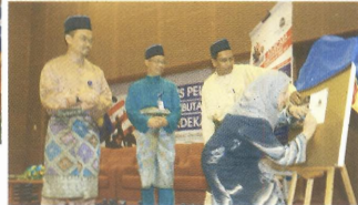
▶ Pelancaran Antologi Lirik Patriotik