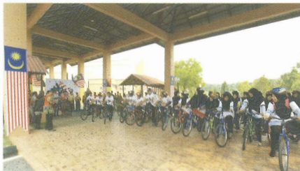
▶ Pelepasan Ekspedisi Kayuhan Merdeka