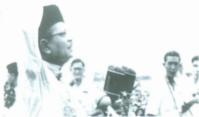
YTM Tunku Abdul Rahman melaungkan 'MERDEKA'