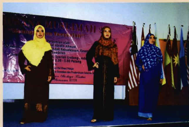
Para pelajar USIM bergaya sebagai model untuk Busana Muslimah

Antara faedah program ialah menonjolkan bagaimana seorang muslimah dapat memakai pakaian yang menutup aurat, tetapi dalam masa yang sama turut tidak meminggirkan elemen keanggunan fesyen yang terkini untuk menyerlahkan lagi personaliti dan keterampilan yang menarik. Di samping itu juga program ini dapat memberi peluang kepada pelajar membentuk imej tersendiri sebagai persediaan menempuhi alam kerjaya serta dapat mencungkil bakat pelajar mencipta satu rekaan fesyen busana muslimah yang sesuai diguna pakai di USIM.