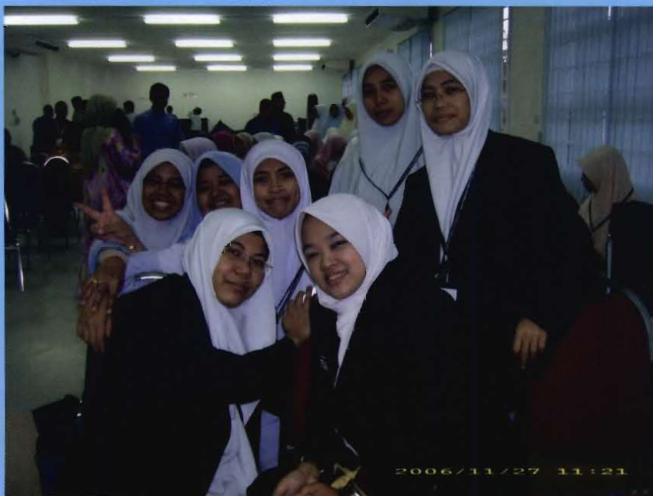
طالبات أوسيم مع طالبات الجامعة الإسلامية العالمية.

وكان حظ النجاح والفوز لجامعة ملايا (UM) كالمرتبة الأولى في هذه المسابقة وتمنح لفريقها جوائز بمبلغ قدره خمسة آلاف رنجيت ماليزية والكأس الملكي الدوري والكأس الإضياف وشهادة بالمشاركة.