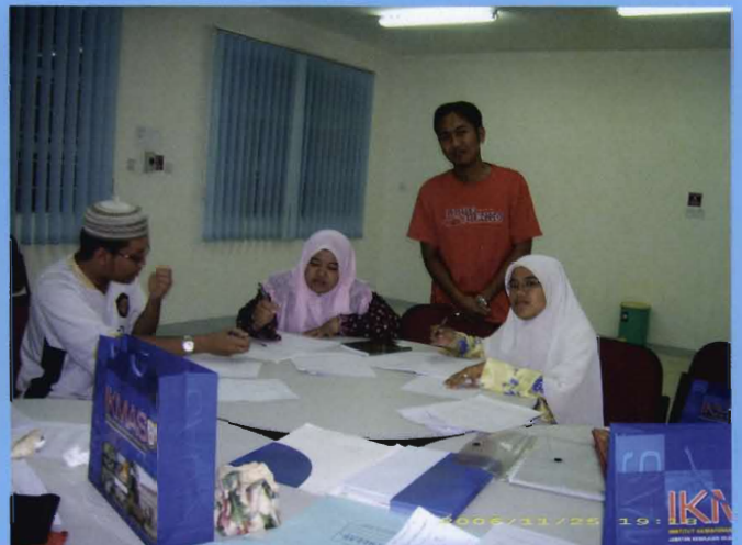
طالبة و طالبات، أوسيم يتناقشون في طرق الخطابة الناجحة.