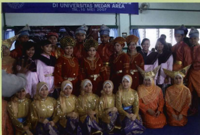
Kumpulan Kesenian USIM bersama Kumpulan Budaya Universitas Medan Area.