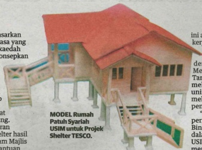
MODEL Rumah Patuh Syariah USIM untuk Projek Shelter TESCO.