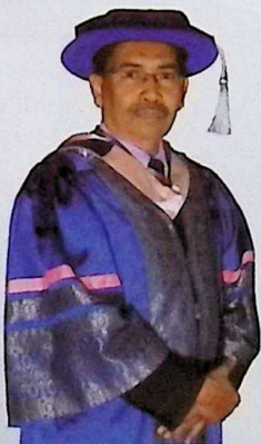
Dekan Penyelidikan & Inovasi • Dean of Research and Innovation • عميد الأبحاث والإبداع