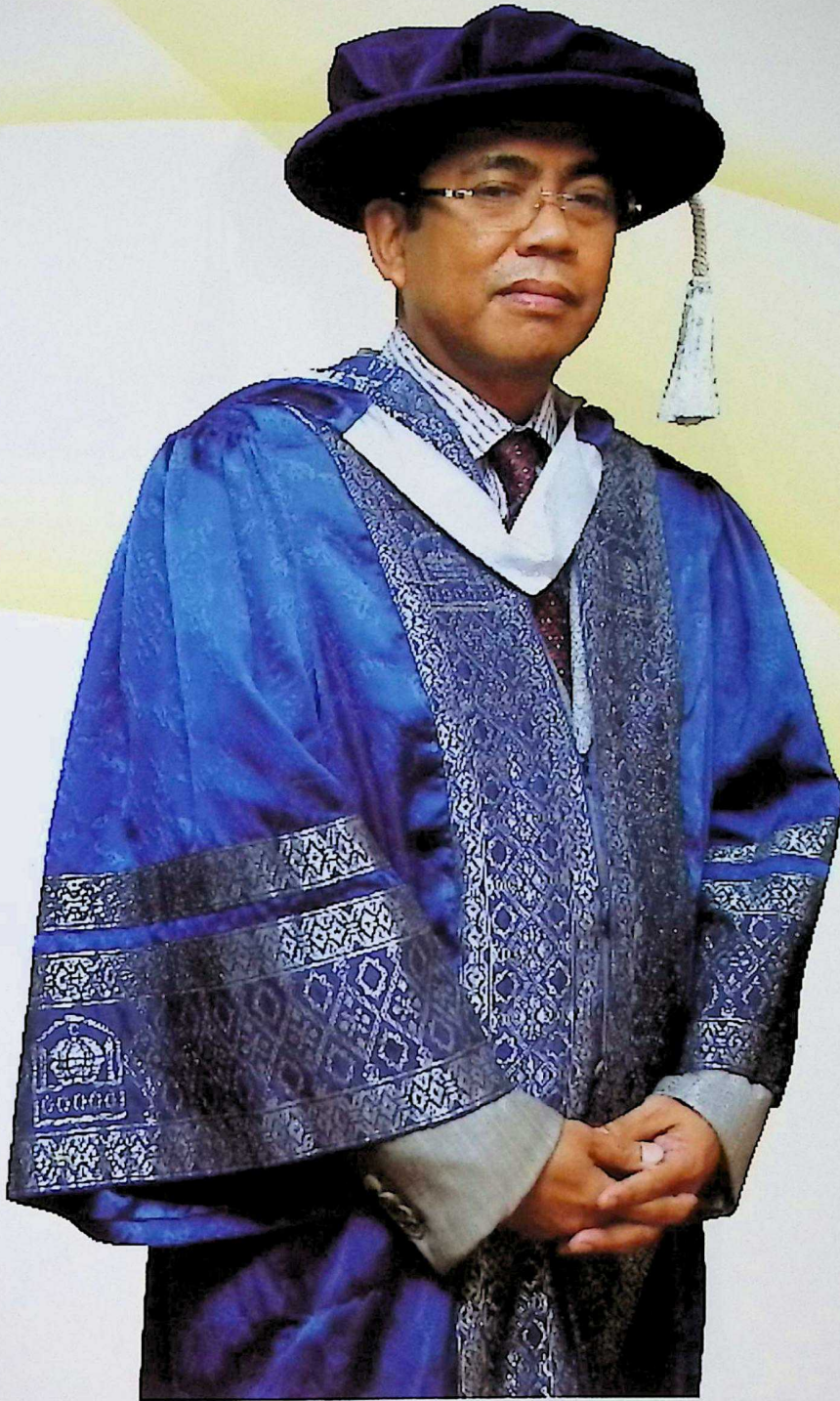
YB DATO' SERI MOHAMED KHALED NORDIN SPMP, SIMP, DIMP, DSPN, SMJ, PIS