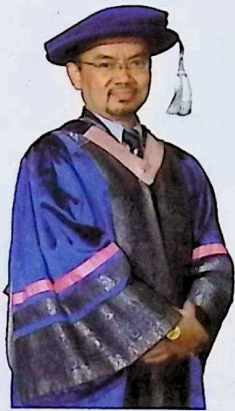
Timbalan Naib Canselor (Akademik dan Antarabangsa) • Deputy Vice Chancellor (Academic & Internationalisation) • نائب الرئيس لشؤون الأكاديمية والدولية