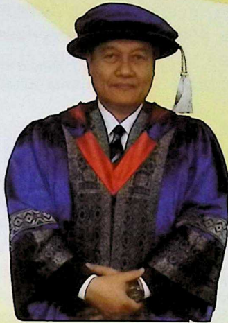
Naib Canselor • Vice Chancellor • رئيس الجامعة