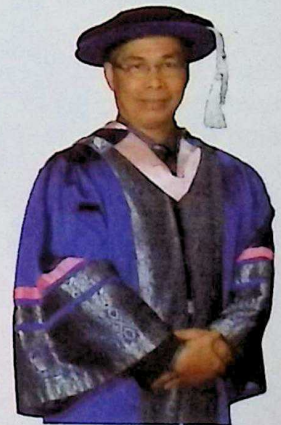
Timbalan Naib Canselor ( Hal Ehwal Pelajar dan Alumni) • Deputy Vice Chancellor (Student Affairs & Alumni) • نائب الرئيس لشؤون الطلبة والخريجين