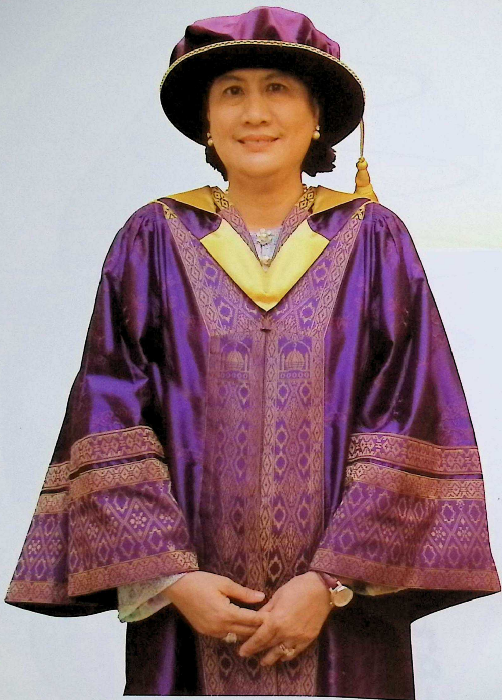
DULI YANG MAHA MULIA TUNKU AMPUAN BESAR NEGERI SEMBILAN TUANKU AISHAH ROHANI BINTI ALMARHUM TENGKU BESAR MAHMUD DK (NS), DPTJ TUANKU CANSELOR • CHANCELLOR • المستشارة الملكية