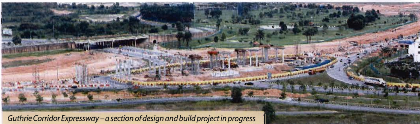
Guthrie Corridor Expressway – a section of design and build project in progress