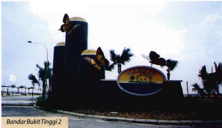
Bandar Bukit Tinggi 2

WCT has the vision to be a leader in the field of engineering, construction and property development and strives to be a successful well-diversified corporation in the country from main and turnkey contractor to eventually involve in privatisation projects.