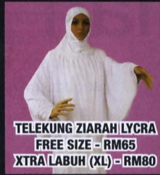
TELEKUNG ZIARAH LYCRA FREE SIZE - RM65 XTRA LABUH (XL) - RM80