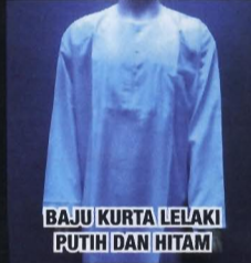
BAJU KURTA LELAKI PUTIH DAN HITAM