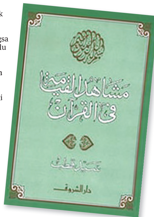
BUKU karangan Syed Qutb bertajuk Pemandangan Kiamat Dalam Quran .

Dalam bukunya Pemandangan Kiamat Dalam Quran , Sayyid Qutb membawa 150 gambaran hari kiamat yang terdapat