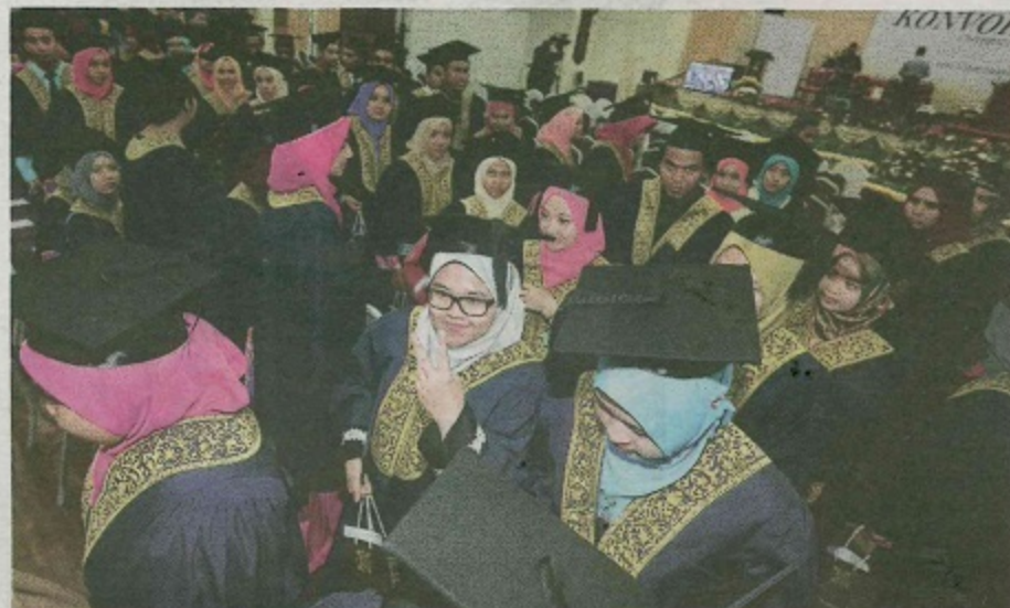
SISWAZAH yang sudah menamatkan pengajian perlu bersiap sedia berdepan dengan cabaran dunia pekerjaan. - gambar hiasan.

Pelajar perlu dapatkan maklumat lengkap supaya tidak timbul masalah ketika pembelajaran mahupun mencari pekerjaan