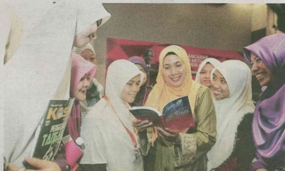
DAPATKAN maklumat lengkap mengenai program baru supaya tidak timbul masalah kemudian hari sama ada dalam proses pembelajaran mahupun ketika mencari pekerjaan. - Gambar hiasan