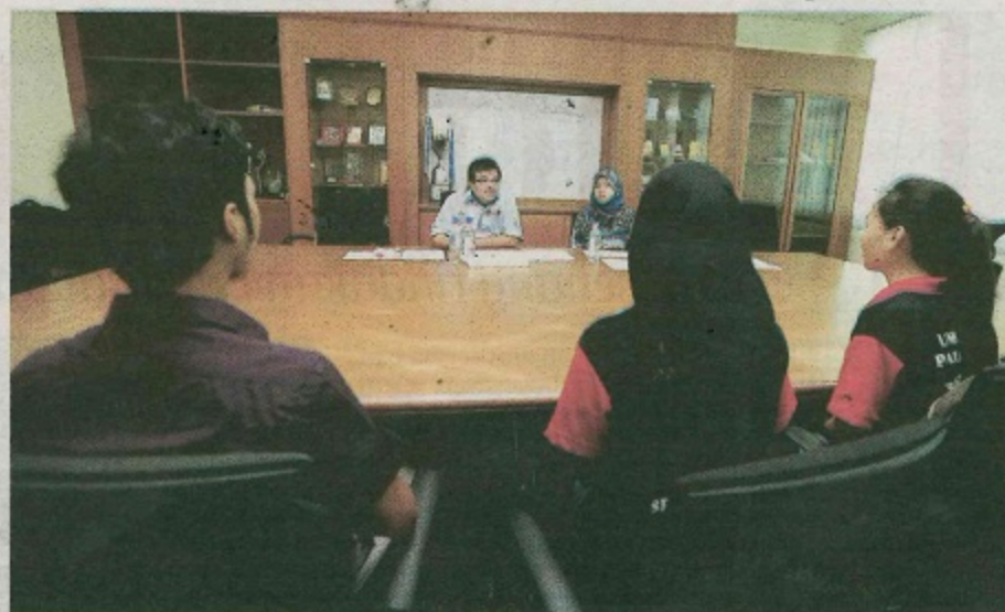
PROGRAM baru masih mampu menawarkan pekerjaan cuma agak terbatas dan memerlukan syarat tertentu seperti pemilihan jantina contohnya. - Gambar hiasan

Ada pihak menyalahkan institusi kerana menawarkan program baru