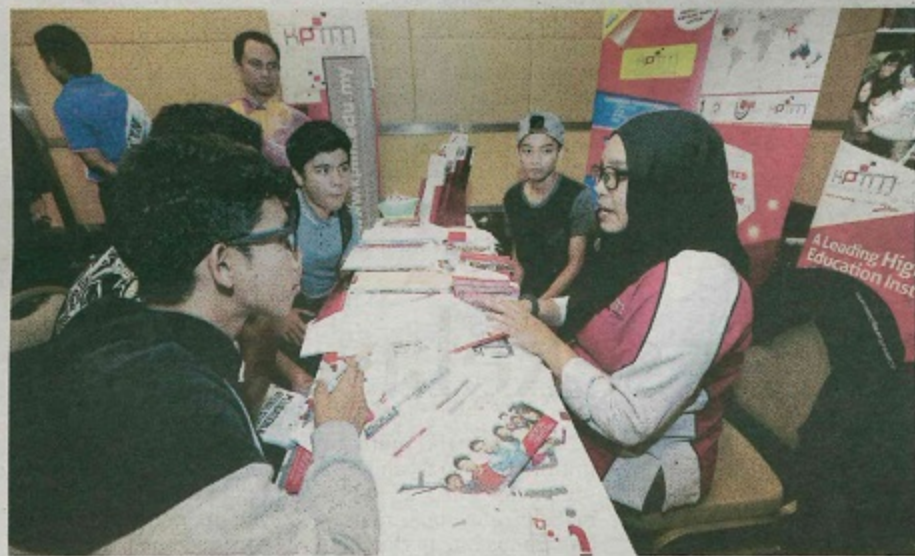
ADA pihak menyalahkan institusi kerana menawarkan program baru yang diketahui belum mampu memberi peluang pekerjaan, namun persepsi berkenaan perlu diperbetulkan kerana ia penting bagi menampung keperluan jangka panjang negara. - Gambar hiasan

"Justeru, tidak perlu meletakkan kesalahan pada pengenalan program baru sebaliknya mencari alternatif membantu siswa seperti memperkenalkan pelbagai modul pengajian berbentuk akademik atau pengukuhan kemahiran insaniah," katanya.