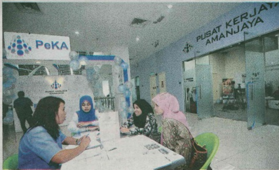
JANGAN salahkan siswazah yang mengikuti program baru sebagai punca siswazah program sedia ada sukar memperoleh pekerjaan sebaliknya perlu melihat faktor kelemahan diri sendiri sebagai penyumbang. - Gambar hiasan