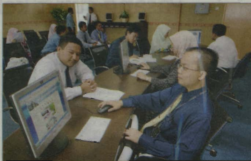
RUANG selesa One Stop Centre atau Pusat Setempat yang diwujudkan dengan matlamat menyediakan kemudahan dalam pelbagai urusan kepada pelajar dan pelanggan KUIM

Kata Abdul Shukor, sebanyak 40 peratus yang mengambil ijazah lanjutan di KUIM terdiri daripada pelajar luar ne-