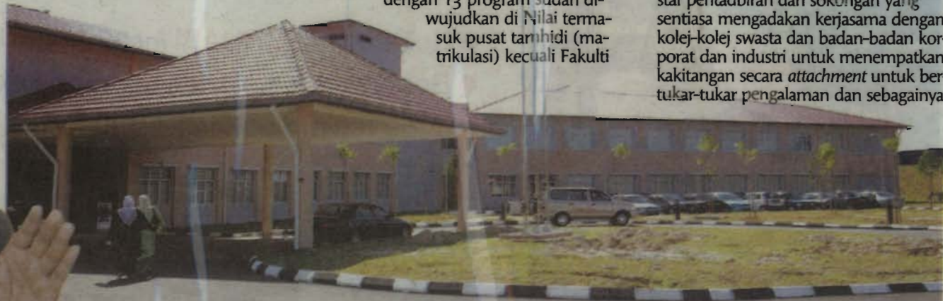
FAKULTI Kepimpinan dan Pengurusan yang turut menempatkan Fakulti Ekonomi dan Muamalat dan Fakulti Sains dan Teknologi KUIM.