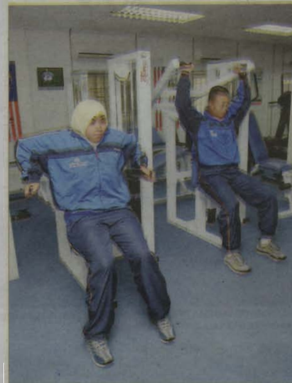
SUNGGUHPUN bidang akademik adalah prioriti kepada pelajar KUIM namun segelintir mereka juga cemerlang dalam bidang sukan.

“Keunikan seni bina di KUIM ialah susunan bangunannya menghadap kiblat serta konsep asalnya adalah diadaptasi daripada al-Hamrah di Sepanyol di mana ada aliran air serta pancuran air. Walau bagaimanapun, tumpuan lebih akan diberikan kepada bangunan pentadbiran kerana ia dianggap mercu tanda KUIM,” katanya.