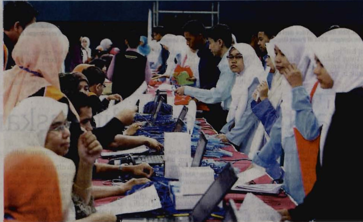
SEBAHAGIAN daripada pelajar mendaftar di Universiti Sains Islam Malaysia, Nilai, Negeri Sembilan, baru-baru ini.

"Inisiatif ini amat selari lebih-lebih lagi bagi sebuah universiti Islam iaitu mementingkan kecekapan dan keberkesanan dalam apa juga kerja