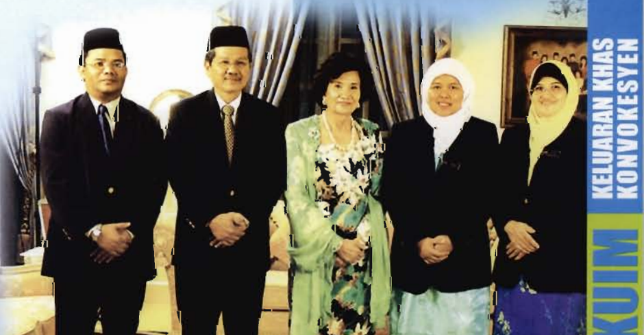
TUANKU Canselor menerima kunjungan hormat daripada pegawai kanan universiti.