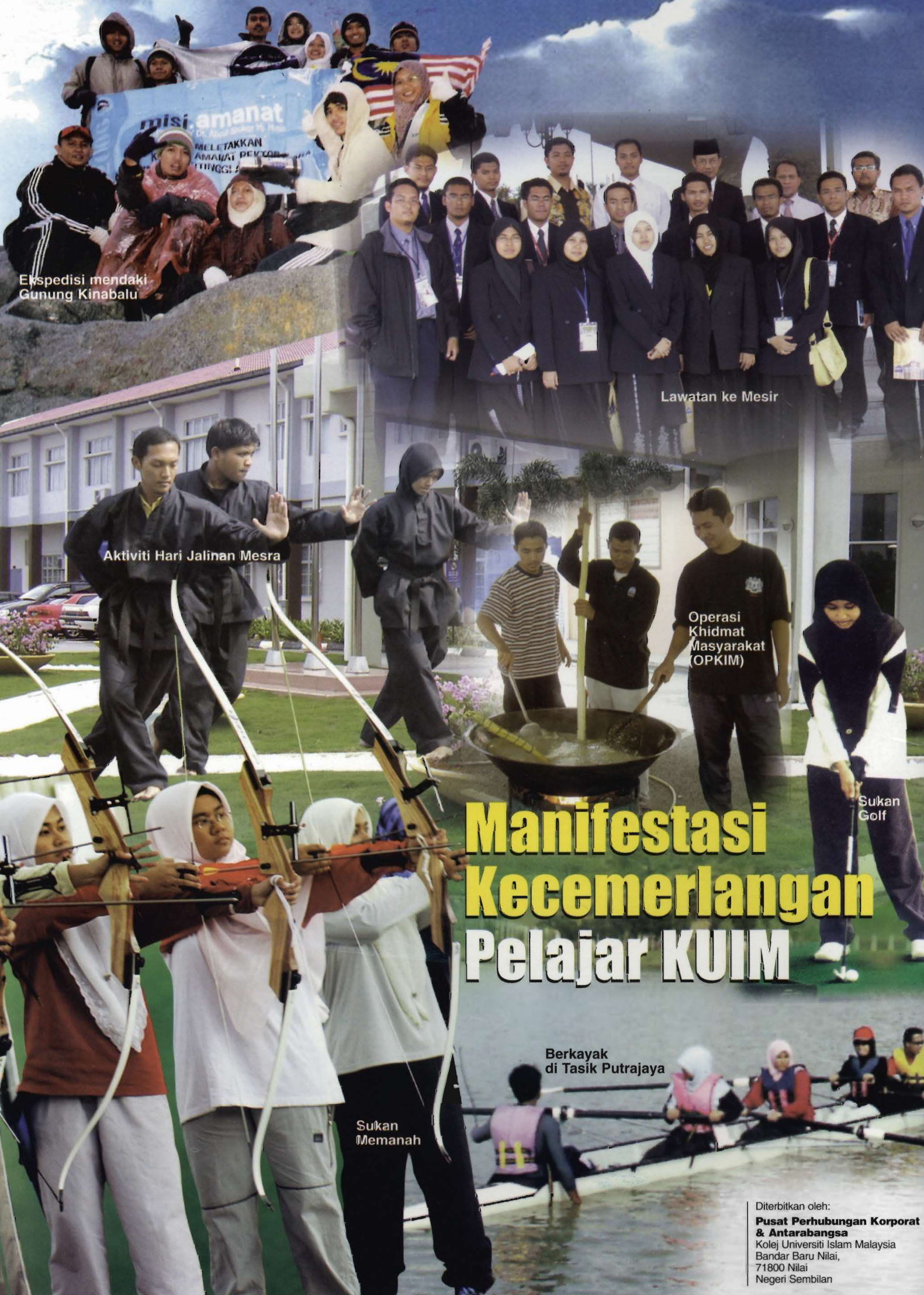
Ekspedisi mendaki Gunung Kinabalu