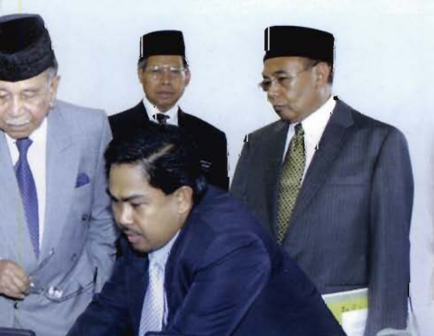
YANG DiPertuan Besar Negeri Sembilan, Tuanku Jaafar Tuanku Abdul Rahman sedang mendengar taklimat daripada salah seorang pegawai INFAD.