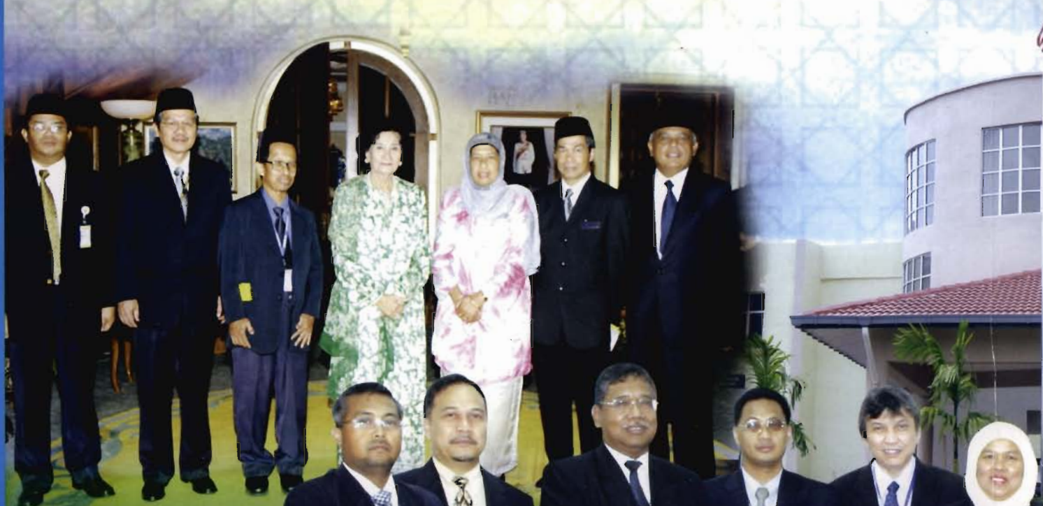
MAJLIS menghadap Canselor pada 9 Ogos 2006.