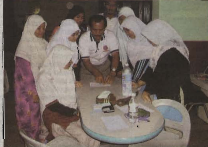
AKSI... mahasiswa menunjukkan kebolehan.