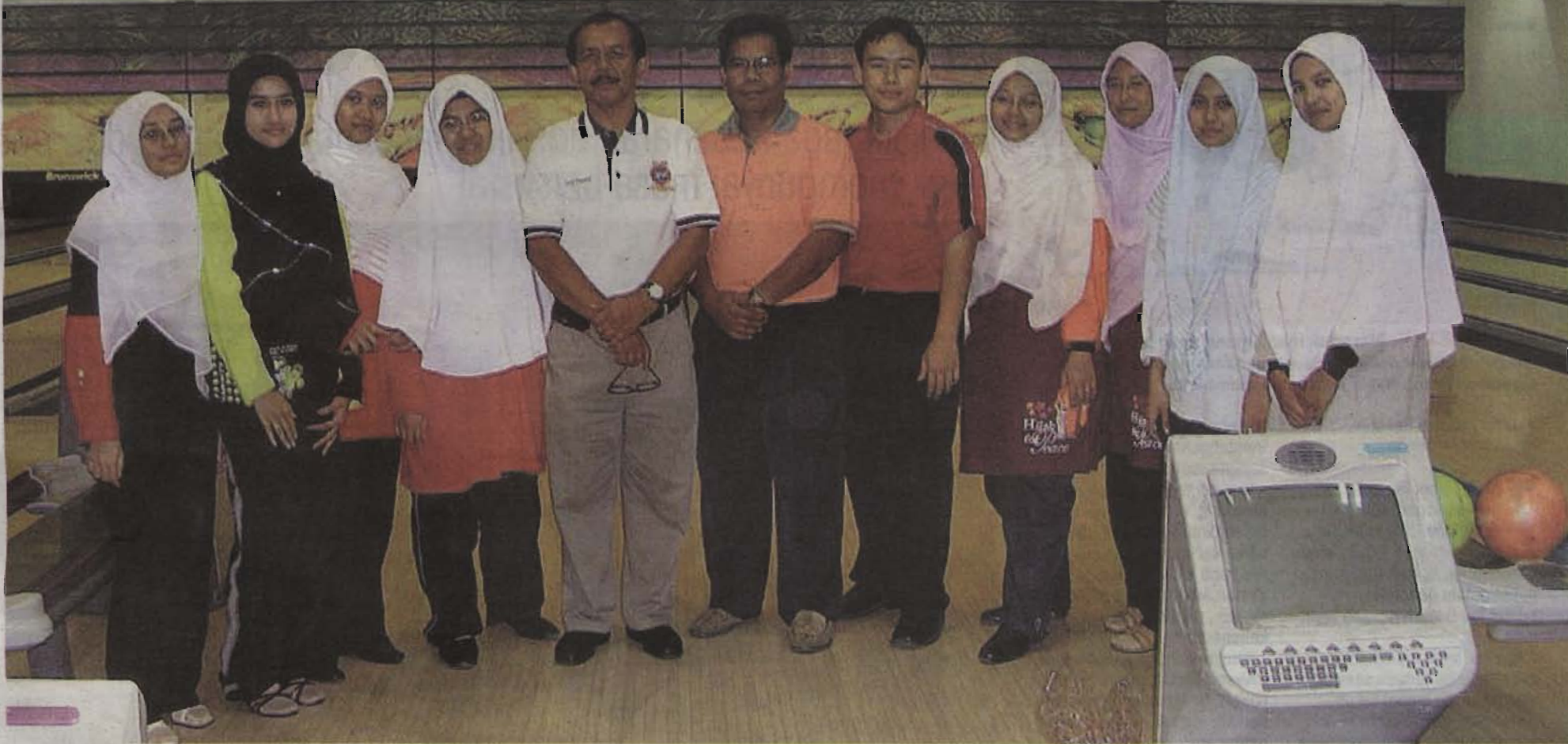
JALANI LATIHAN... antara mahasiswa yang mengikuti kursus boling ditawarkan USIM.