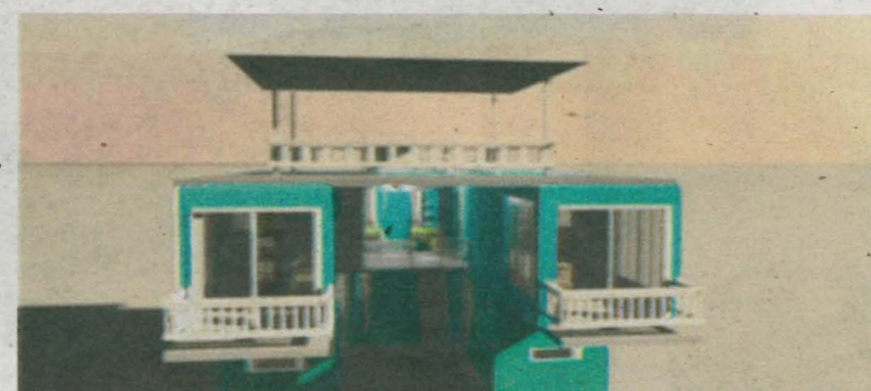
RUMAH kontena boleh menjadi alternatif kediaman masa depan di Malaysia.

"Secara jujurnya, saya tidak pernah tidur di dalam kontena. Tidur di rumah sendiri adalah pengalaman pertama yang sungguh mengujakan," kongsi jurutera perisian itu. Bercerita tentang keputusan yang dibuat tahun lalu itu, Muhamad Azree memberitahu, jika dihitung kadar gajinya, dia mungkin layak membeli sebuah kediaman dengan membuat pinjaman tempoh yang panjang. Namun, dia memilih untuk tidak terikat dengan bebanan hutang dalam tempoh yang lama. Dia juga mahu melihat