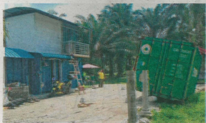
RUMAH kontena milik Muhamad Azree yang terletak di Sijangkang kini dalam proses pengubahsuaian.