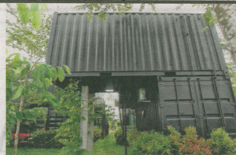
THE Kabin menggunakan konsep kabin atau kontena untuk menarik para pengunjung.

Boleh memuatkan 78 pengunjung pada satu-satu masa, The Kabin yang mahu tampil eksklusif sentiasa dipenuhi pengunjung terutamanya pada hari-hari minggu, cuti umum dan musim cuti persekolahan kerana pelbagai kemudahan yang disediakan seperti kafe,