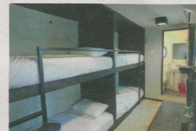
SUASANA dalam bilik The Kabin yang menawarkan penginapan unik berbanding kediaman biasa.

"Teknologi terkini boleh membantu memanjangkan jangka hayat sesebuah kontena selain menjadi rumah yang kondusif untuk didiami," kongsi beliau.