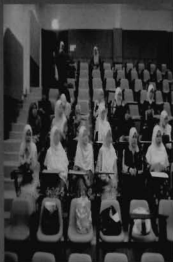
Student should give their concentration in lecture to avoid misunderstanding.