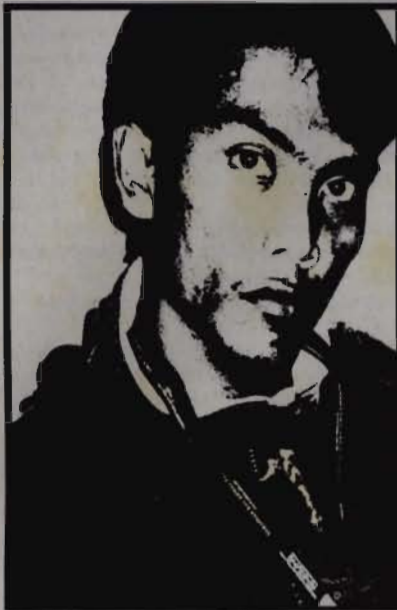
Every people have different personality and attitude

Learn Something About Yourself Don't look at the answers at the bottom. Do the test first