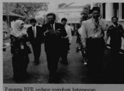
Pegawai BPR sedang memberi keterangan

"Lawatan sebegini banyak membantu kami dalam memperoleh idea-idea baru terutama selepas sesi soal jawab bersama pelajar-pelajar"