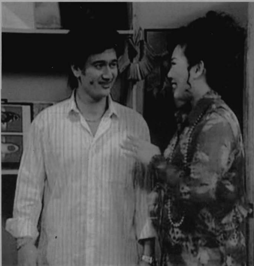
The usage of Malaysian English still widen until now.

"Of late, the private investigators market has become so competitive that almost everyone can afford our services now," he added.