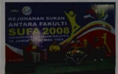
Perasmian SUFA 2008

Dato': Pada saya semua mempunyai peluang sama, yang membezakan hanya pasukan yang mempunyai komitmen tinggi, mereka yang akan bergelar juara. Ini kerana, peluang dan latihan yang diberi adalah sama, atlet yang merebut peluang itu dan bersungguh-sungguh berlatih dan mempunyai cara permainan yang baik, mereka yang akan berjaya. Tidak boleh bergantung kepada nasib semata-mata.