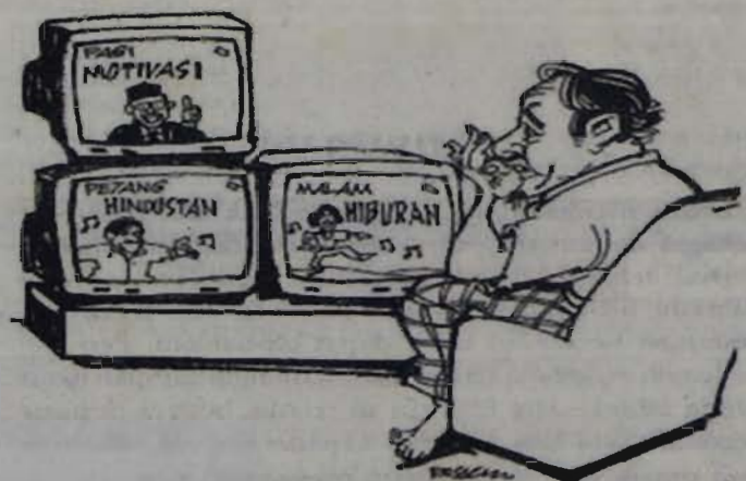
Cara TV Malaysia mendidik masyarakat.