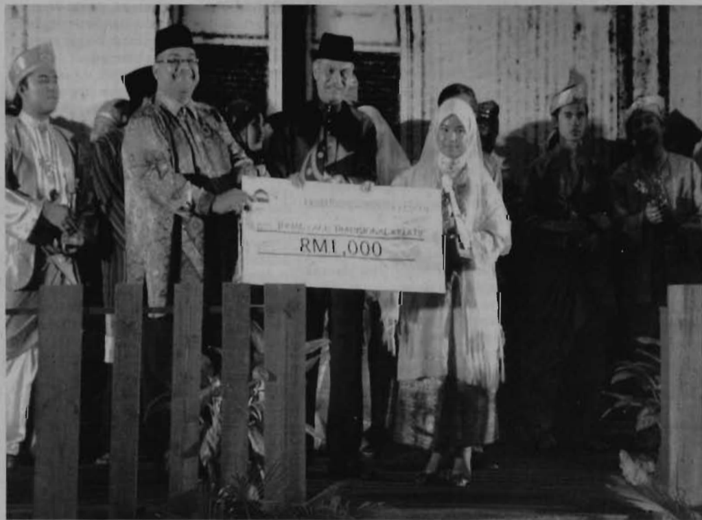
Senator bersama Johan Kategori Tradisional Kreatif FESLAM 2008