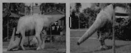
Dinosour: Simbol yang musnah di Nilai 3

Manakala Badrul Hisyam Ahmad, 33, seorang penyelia kilang dari Kajang berharap agar Majlis Perbandaran Nilai (MPN) mengambil tindakan segera untuk memulihkan bahagian yang rosak pada replika tersebut agar imej Nilai 3 sebagai pusat borong terkenal di Malaysia tidak tercalar dengan perkara seperti ini.