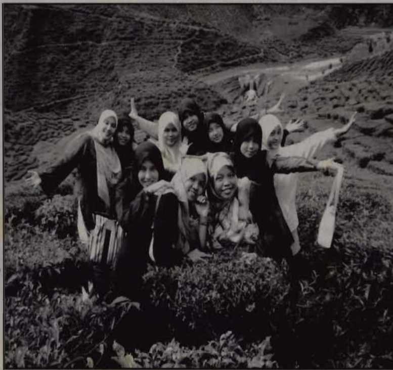
Friends who with us while we in happy or sad time

Love is not about "it's your fault", but "I'm sorry." Not "where are you", but "I'm right here." Not "how could you", but "I understand." Not "I wish you were", but "I'm thankful you are?"