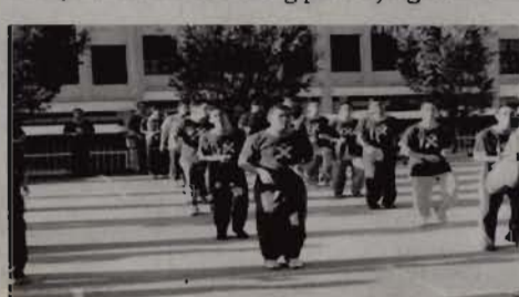
Sebahagian penghuni kolej yang menyertai acara senamrobik

Majlis yang bermula pada jam 8 pagi dengan acara senamrobik yang diketuai oleh Azam Entertainment, menarik minat 70 orang peserta yang terdiri daripada penghuni kolej kediaman tersebut. Selain senamrobik, permainan bola jaring lelaki, futsal serta sukaneka turut diadakan.