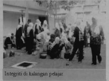
Integriti di kalangan pelajar

Aktiviti menanam pokok bunga berakhir kira-kira jam 6.00 petang, majlis diakhiri dengan jamuan ringan yang telah disediakan oleh pihak fakulti kepada para pensyarah, kakitangan dan pelajar.