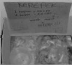
Antara barang jualan di tepi tangga

"Rugi adalah risiko bisnes, kadang-kadang duit dan barang jualan hilang dikebas orang"