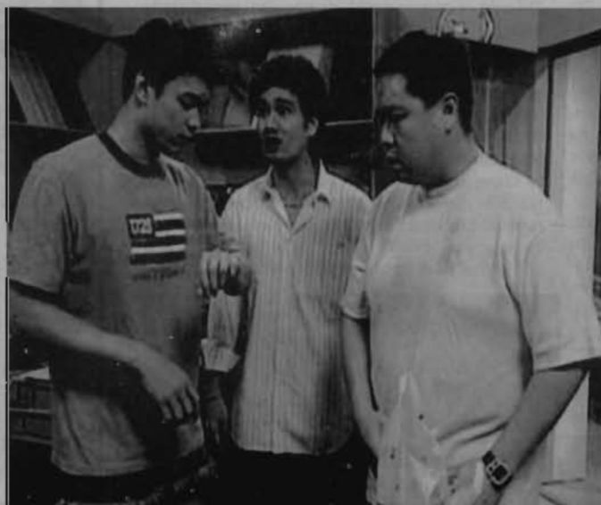
Phua Chu Kang sitcom is the popular drama used Malaysian English

However, as Malaysia still adopts Standard British English as the pedagogical model (Gill, 1994), there is a tendency to view the growth of their own variety, ME as being 'corrupted' and of lower prestige than British English. Nonetheless, this need not be so. ME speakers and sociopolitical state are bilingual in nature. Therefore, their use of English would breed differently than English used by the native British speakers.