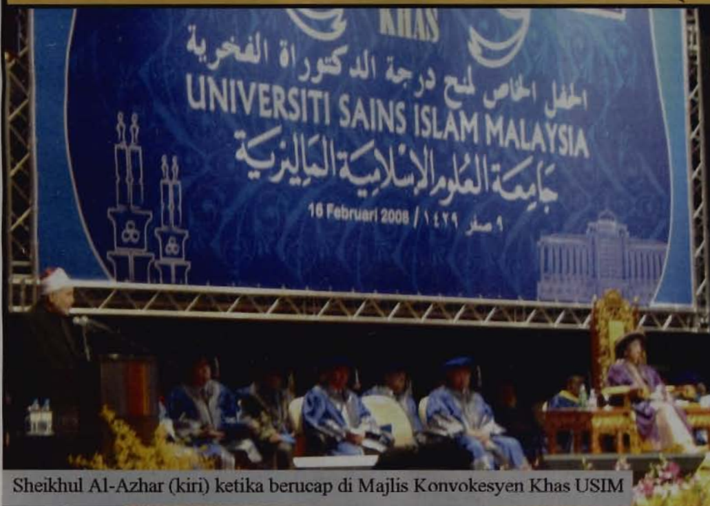
Sheikhul Al-Azhar (kiri) ketika berucap di Majlis Konvokesyen Khas USIM

“Ini merupakan salah satu usaha dan pendekatan USIM dalam memartabatkan Pengajian Islam di mata dunia serta menjadikan Sheikhul Al-Azhar sebagai sumber inspirasi. Personaliti dan sahsiah yang dimiliki beliau, wajar dicontohi oleh umat Islam khususnya mahasiswa USIM”