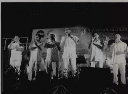
Kumpulan Instinct turut menjayakan Konsert 'Gema Alam'

"Selain berpeluang untuk membeli barang, para pengunjung juga berpeluang untuk menyertai pelbagai aktiviti yang menarik antaranya auto show dan minibike ," jelasnya.