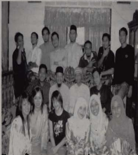
Happy life without heart disease

More women in the US under 45 are dying of heart disease due to clogged arteries, the result of escalating obesity and diabetes, a new study found.