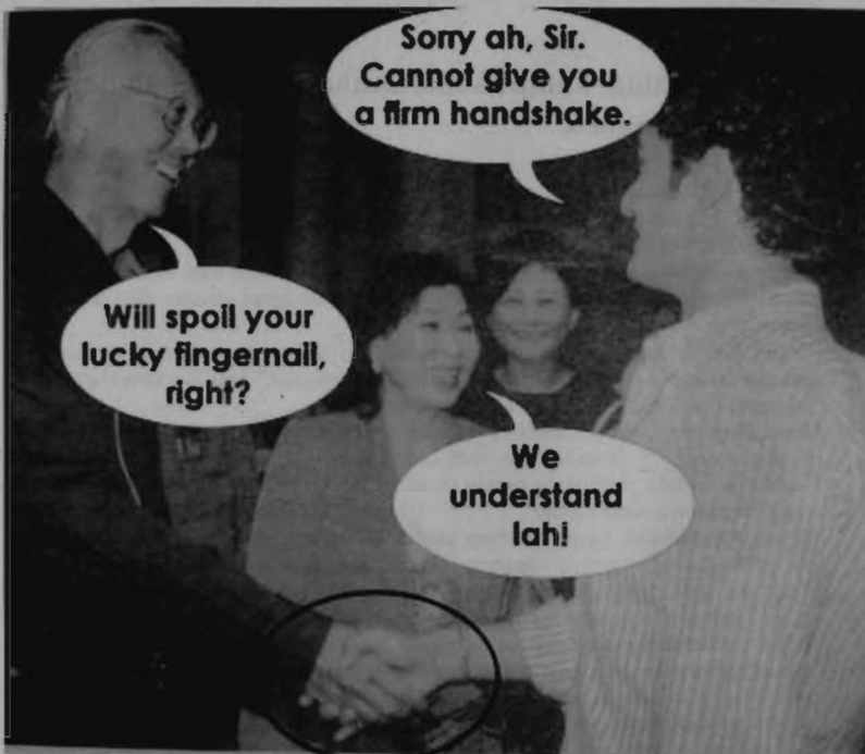
'lah' and 'kan' are words that usually used among Non-native speakers in Malaysia.