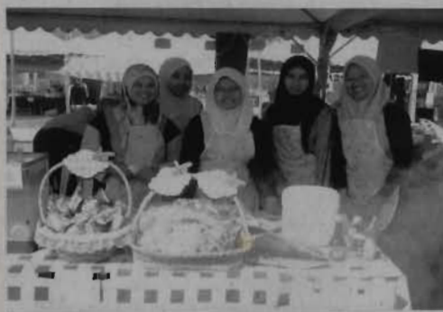
Pelajar USIM yang turut berniaga di iCEPS.

Majlis penutup Konvensyen ini telah disempurnakan oleh Menteri Besar Negeri Sembilan, Dato' Seri Utama Haji Mohamad Bin Haji Hasan.