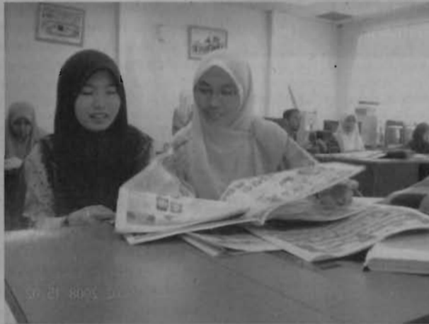
يقرأ الطالبان الجريدة

لقد حاولت بعض الصحف الأميركية في السنوات القليلة الماضية التقرب من فئة الشباب. وهكذا، نشرت "ذي شيكاغو تريبيون" صحيفة خاصة موجهة للقراء الشباب أطلق عليها "ريد آي"، لديها 280000 قارئ يومي. ومن جهتها، باتت "نيوز داي" تتوفر على ملحق أسبوعي يشجع طلبة الجامعات والمدارس الثانوية والإعدادية على إرسال مقالات رأي. أما "بوسطن جلوب"، فقد بدأت للتومطبوعة موجهة للمراهقين تسمى "بوسطن تيزر".