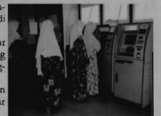
Pelajar beratur panjang untuk mengeluarkan wang

"Setahu saya masalah ini telah diberi perhatian dan tindakan juga telah diambil. Saya tidak tahu kenapa masih tiada penambahan mesin ATM," jelasnya.