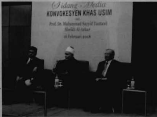
Sheikhul Al-Azhar (tengah) ketika sidang akhbar berlangsung.

"Saya juga berharap pelajar USIM khususnya dan pelajar IPT di seluruh dunia amnya memperjuangkan ilmu dan sentiasa berijtihad serta bersabar dalam mencari ilmu kerana ilmu sangat penting dan orang-orang yang berilmu (ulama) adalah pewaris nabi," tambah beliau lagi.