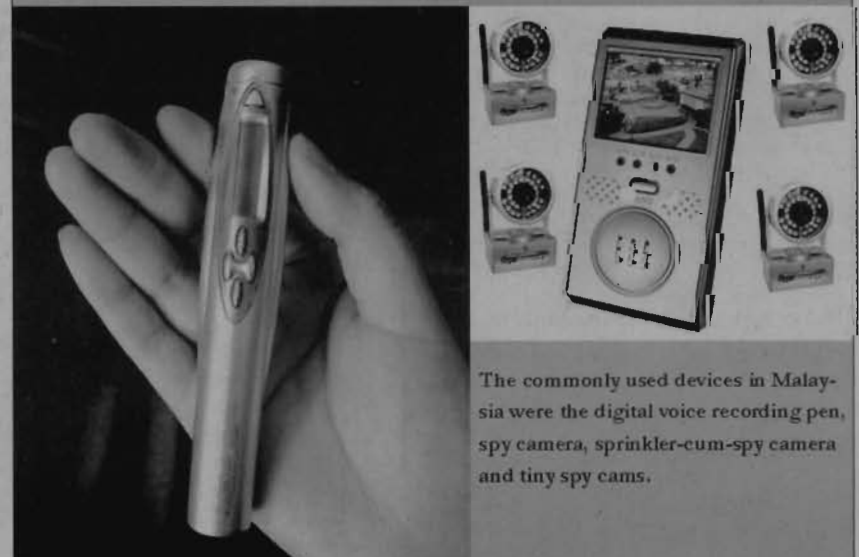
The commonly used devices in Malaysia were the digital voice recording pen, spy camera, sprinkler-cum-spy camera and tiny spy cams.