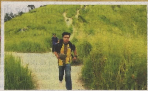
ANTARA babak menarik dalam PSA berdurasi hampir dua minit di Bukit Broga.