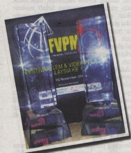
DUA trofi Anugerah PSA terbaik dan Anugerah Khas Juri berjaya dirangkul produksi video pendek KUIS.

mempunyai fikrah Islam dan berkemahiran tinggi bersesuaian dengan motonya untuk melahirkan generasi ulamak dan umara," katanya.