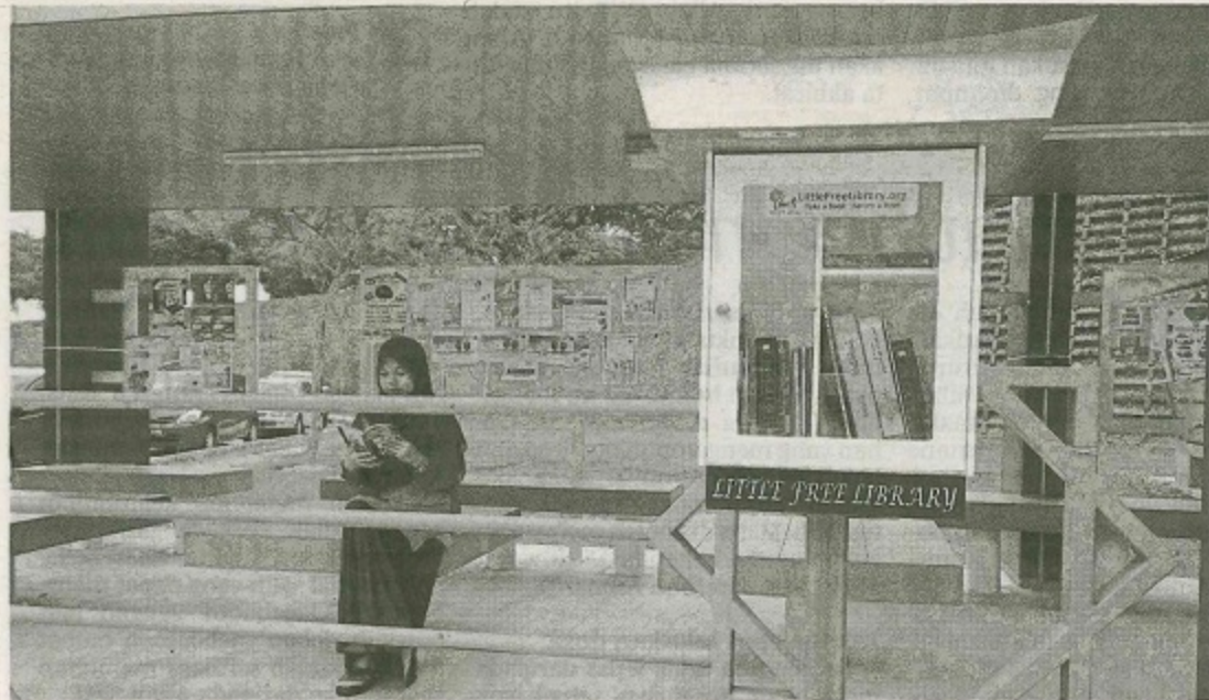
Perpustakaan mini berbentuk rumah Minangkabau di USIM.

Sebagai seorang mahasiswa, saya ingin mengucapkan sekalung tahniah kepada Perpustakaan Universiti Sains Islam Malaysia (USIM) kerana mewujudkan Little Free Library (LFL) atau perpustakaan mini di sekitar kawasan kampus.