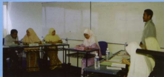
• Para peserta debat Bahasa Arab peringkat Universiti sedang rancak berdebat

Pertandingan Debat Bahasa Arab Peringkat Universiti merupakan program yang julung-julung kali diadakan bagi percubaan peringkat pertama. Pertandingan ini memperlihatkan KUIM sebagai perintis dalam usaha menguasai Bahasa Arab sebagai bahasa pengantar kedua di samping Bahasa Inggeris. Bertempat di Menara B, tarikh 13 Januari itu telah menyaksikan beberapa peserta dari pelbagai fakulti menyertai pertandingan tersebut. Ternyata cita-cita KUIM menjadikan bahasa Arab sebagai aset dalam memelopori sesebuah bidang hampir tercapai dengan terlaksananya debat dalam bahasa Arab ini. Kursus penghakiman turut diadakan bagi memberi taklimat berkaitan pertandingan yang telah diadakan. Sebanyak 7 penyertaan yang telah diterima dan pertandingan akan diadakan pada 7hb Julai 2003 yang akan dirasmikan oleh Y. Bhg. Prof. Dato' Dr. Abdul Shukur Bin Hj. Husin Rektor KUIM.