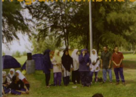
• Program membina semangat berpasukan pembimbing rakan universiti (PRU)

Program ini telah dianjurkan oleh Pembimbing Rakan Universiti (PRU) dengan kerjasama Unit Kaunseling Dan Pembangunan-Sahsiah. Ia telah diadakan pada 1 Januari 2003 di Camar Laut LKIM, Bagan Lalang, Sepang. Seramai 45 orang