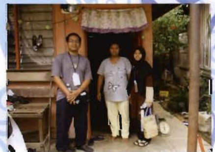
Kenangan sesi ziarah penduduk.