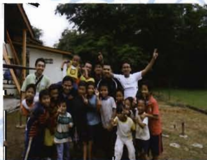
Mereka memerlukan bimbingan supaya tidak kecikiran dalam pendidikan.

Program C-VIS 09 merupakan anjuran JAKSA KKSI. Program ini juga turut mendapat kerjasama daripada JHEOA dan Pusat Dakwah Islamiyah Negeri Sembilan. Program ini telah berlangsung selama 3 hari 2 malam yang melibatkan pelajar seramai 80 orang yang terdiri daripada 40 mahasiswa lelaki dan 40 mahasiswa wanita kolej kediaman.