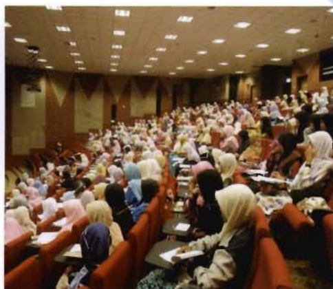
KUSYUK...Para pelajar sedang mendengar ceramah Isra' Mi'raj.

Mereka juga berharap dapat lagi meneruskan usaha dalam menjayakan program-program yang berunsurkan kerohanian dalam membentuk jati diri dalam diri mahasiswa dan mahasiswi USIM pada masa akan datang.