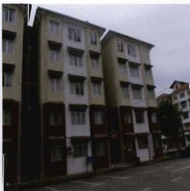
Bangunan Pentadbiran dan Kediaman Pelajar Kolej Kediaman Camelia Court

Kolej Kediaman Camelia Court merupakan kolej kediaman yang menempatkan pelajar Tamhidi dan pelajar antarabangsa sarjana muda. Kolej Kediaman ini merupakan kolej kediaman perempuan. Di kolej kediaman ini juga terdapat satu unit rumah transit khas untuk pelajar antarabangsa sarjana dan PhD yang pertama kali datang ke Malaysia sementara mendapat rumah sendiri.