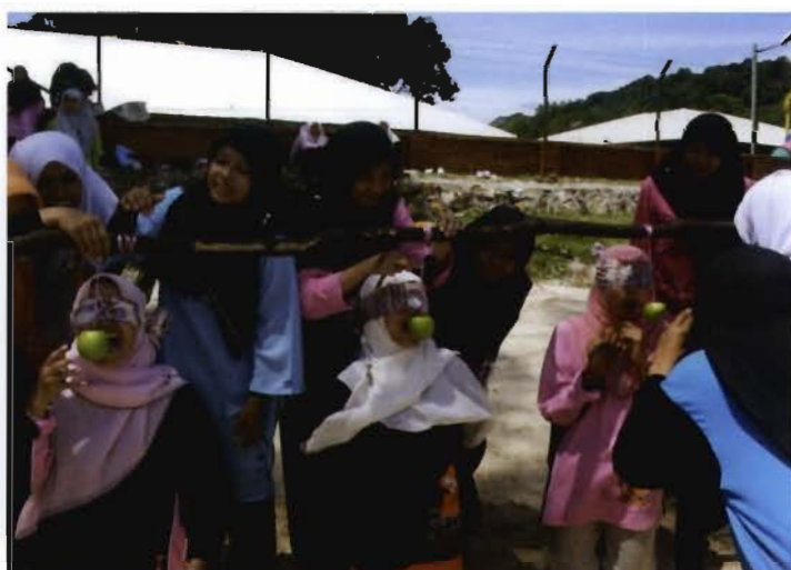
Antara gelagat peserta.

Maklum balas daripada semua peserta adalah mengalakkan, malah mereka terutamanya pelajar terpancar perasaan ceria dan gembira di wajah mereka. Program tersebut berakhir dengan sesi penyampaian hadiah kepada pemenang.