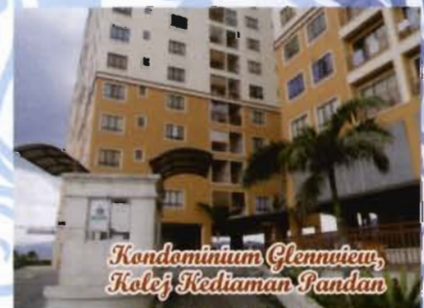
Kondominium Glennview, Kolej Kediaman Pandan