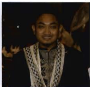
"Program ini tercapai objektif dan diluar jangkauan perlaksanaan"

Dalam MPS 2009 juga terdapat banyak anugerah yang dipertandingkan, antaranya ialah Anugerah Rumah Terbersih, Anugerah Kepimpinan Terbaik, Anugerah Akademik Terbaik, Anugerah Atlit Sukan Terbaik, Anugerah Khidmat Bakti Sutera, Anugerah Sahsiah Terpuji dan Anugerah Mahasiswa Harapan