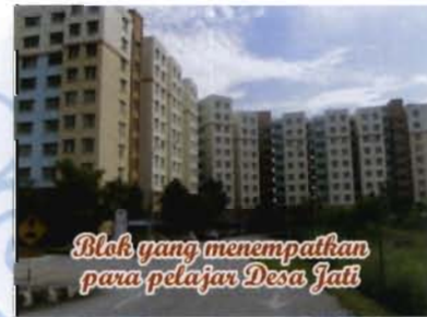
Blok yang menempatkan para pelajar Desa Jati