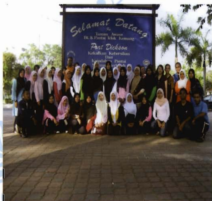
Antara peserta yang menyertai Program.