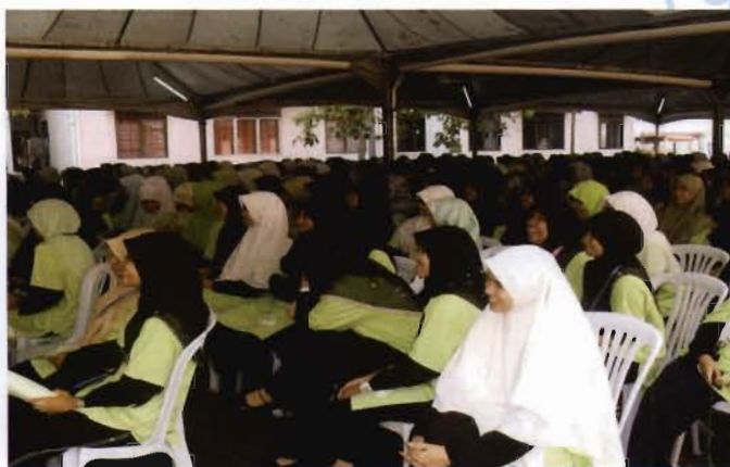
Para pelajar tahun 1 mendengar taklimat yang diberikan oleh Pengetua Kolej Kediaman.

Adalah diharapkan dengan program seperti ini, para pelajar dapat memahami hasrat Universiti serta menjaga Disiplin dan diri selama berada di Universiti Sains Islam Malaysia ini.