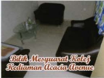
Bilik Mesyuarat Kolej Kediaman Acacia Avenue

Kolej Kediaman Acacia Avenue merupakan kolej kediaman paling bongsu serta termuda kerana baru memulakan operasi dan dibuka pada penghujung tahun 2008. Dengan jarak yang berdekatan dengan Kampus USIM, kolej kediaman ini merupakan kolej kediaman kesukaan dan menjadi rebutan para pelajar.