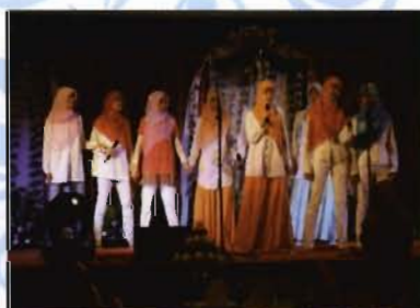
Atas: Pelajar antarabangsa sedang menghiburkan tetamu dengan nyanyian lagu Cina