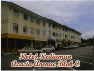
Kolej Kediaman Acacia Avenue Blok C