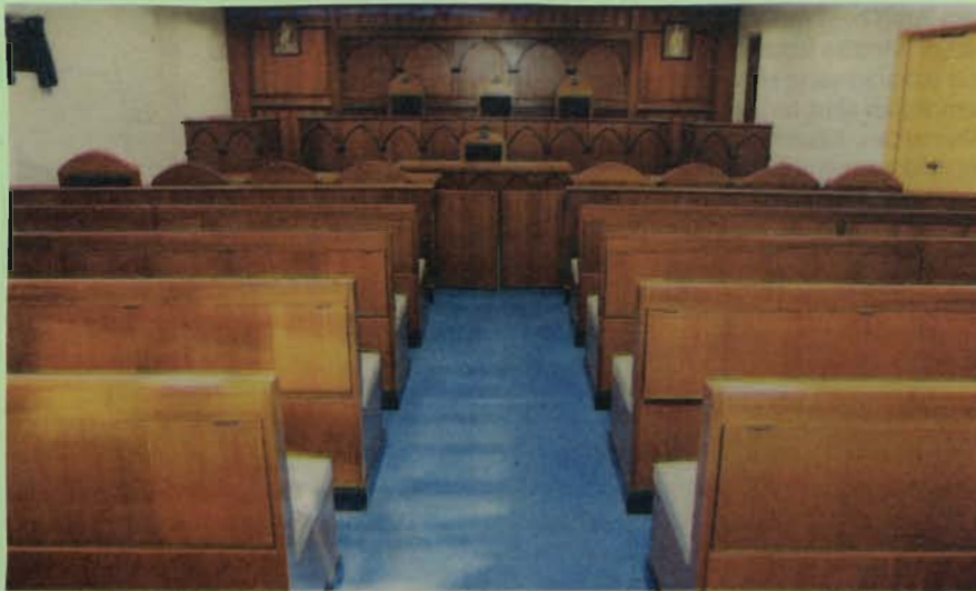
BILIK Moot Court memberi pendedahan awal kepada pelajar FSU.

Pihak fakulti juga dalam proses mendapat kelulusan universiti untuk menawarkan lebih banyak program di peringkat siswazah dalam kedua-dua bidang serta Undang-undang Perbandingan ( Comparative Law ).