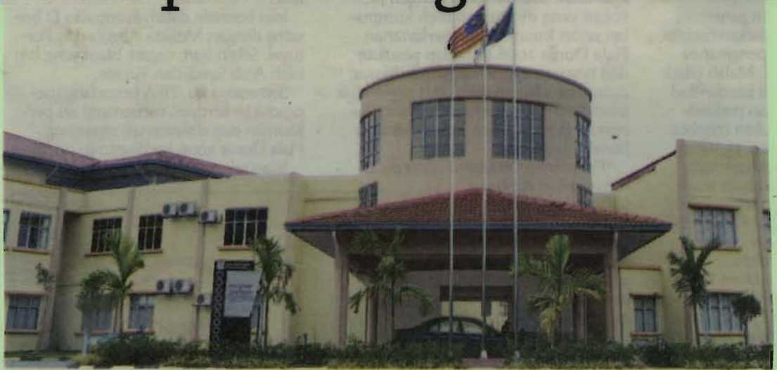
BANGUNAN utama Fakulti Syariah dan Undang-undang (FSU), KUIM di Bandar Baru Nilai, Negeri Sembilan.