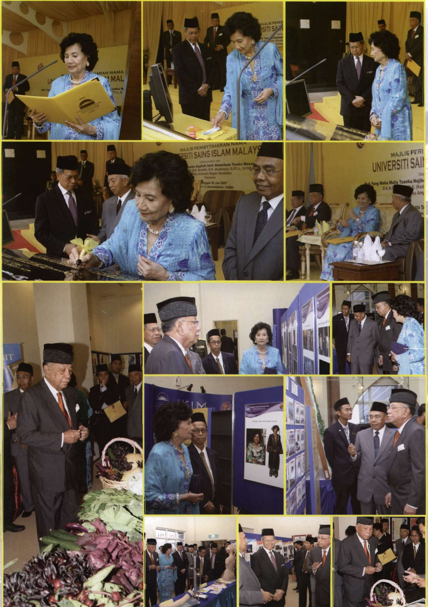
Direkabentuk Oleh : Zypro Advertising & Marketing