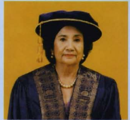
Tuanku Canselor Duli Yang Maha Mulia Tunku Najihah.

Duli Yang Maha Mulia Tunku Ampuan Najihah binti Almarhum Tunku Besar Burhanuddin diputerikan di Seri Menanti. Baginda mendapat pendidikan di Sekolah Melayu Seri Menanti. Baginda kemudiannya melanjutkan pelajarannya ke Sekolah Ingggris Tuanku Muhammad. DYMM Tunku Ampuan turut mengambil kesempatan mempelajari Bahasa Perancis disamping mempelajari pelbagai kursus di London School of Economic (London University)