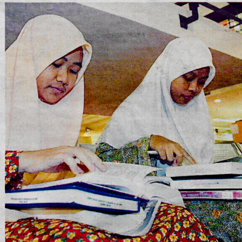
RAJIN... diikuti golongan wanita lebih gemar membaca berbanding lelaki.

konteks luas sebelum dikategorikan sebagai kritikal.