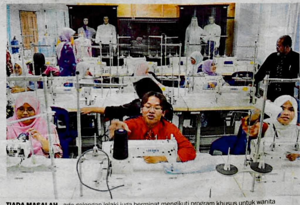
TIADA MASALAH... ada golongan lelaki juga berminat mengikuti program khusus untuk wanita meskipun bilangannya sedikit.