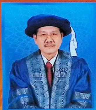
Pendaftar • Registrar