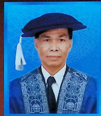
Timbalan Naib Canselor ( Hal Ehwal Pelajar dan Alumni) Deputy Vice Chancellor (Student Affair & Alumni)