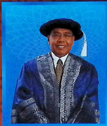
Naib Canselor • Vice Chancellor • مدير الجامعة

Cert. ABMP (Manila), BA (Cincinnati), Ph.D (Manchester)