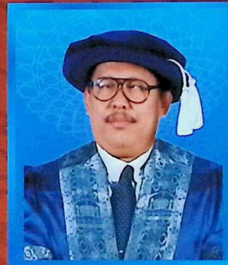
Ketua Pustakawan • Chief Librarian