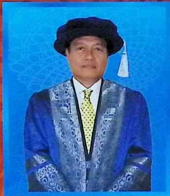
Timbalan Naib Canselor (Akademik dan Antarabangsa) Deputy Vice Chancellor (Academic & Internationalization)