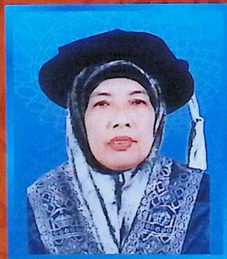
Bendahari • Bursar