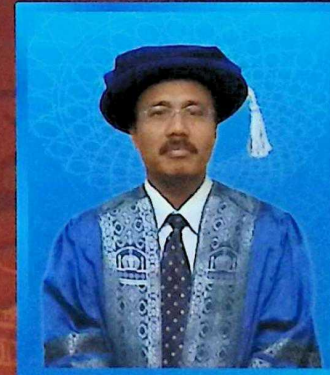
Pengarah Unit Pembangunan