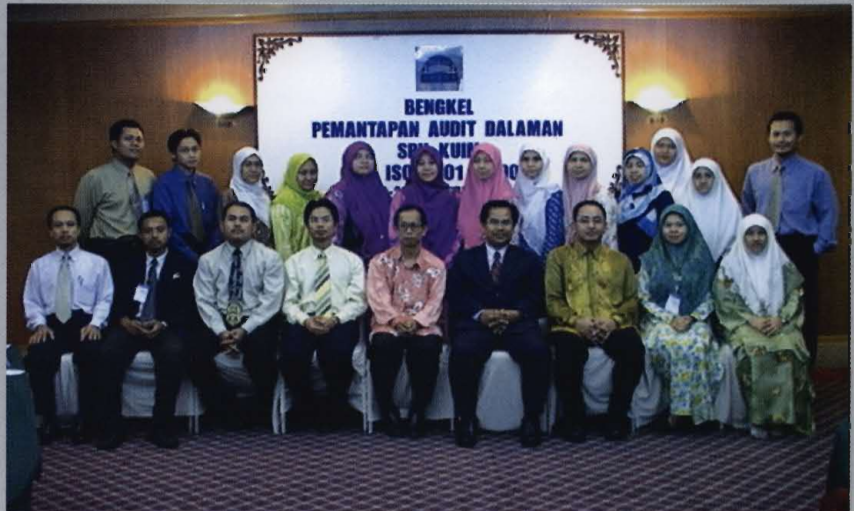
• Kakitangan KUIM yang menyertai Bengkel Pemantapan Audit Dalaman di Allson Klana.

Seramai 29 orang kakitangan KUIM telah menyertai bengkel ini dimana mereka 'adalah terdiri daripada