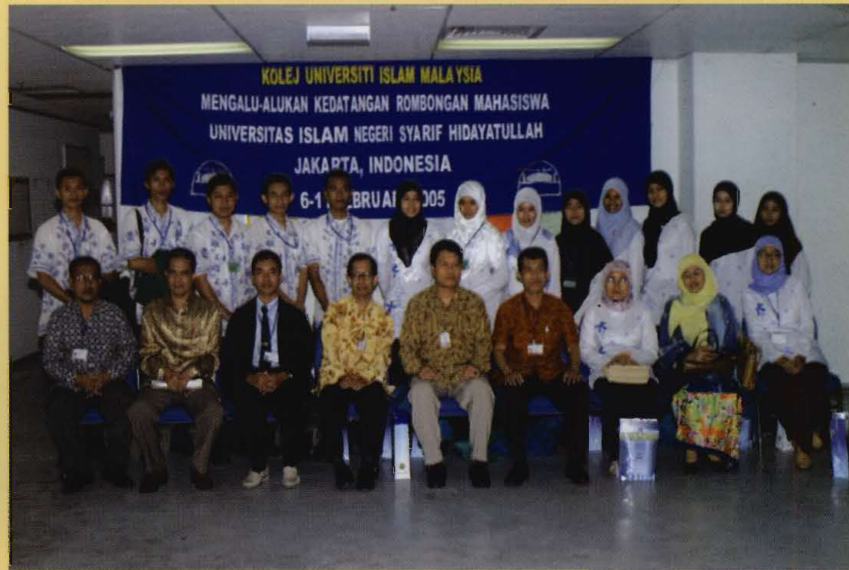
• Pelajar-pelajar dan Pensyarah Universiti Islam Negeri Indonesia