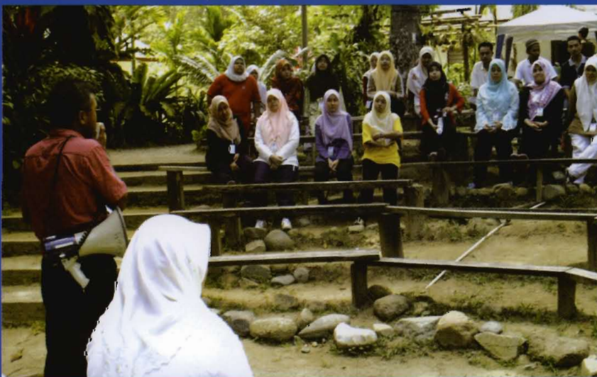
• Para Peserta Kursus Pembinaan Semangat Berpasukan.