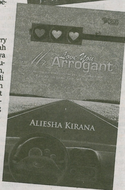
Antara novel yang diadaptasi ke filem dan drama.

Kang Abik dinobatkan sebagai novelis nombor satu Indonesia oleh Insani Universitas Diponegoro. Graduan Universiti Al-Azhar, Mesir ini juga bukan hanya popular di Indonesia, tetapi juga Malaysia, Singapura, Brunei, Hong Kong, Taiwan dan Australia.