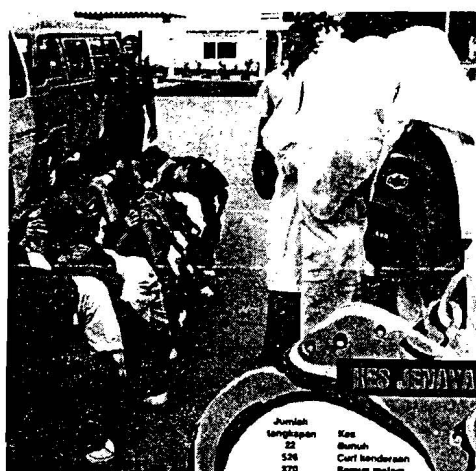
Bolehkah kaunselor menjadi agent of pengawalan sosial yang efektif?

kepada kaunselor adalah seperti tidak menghormati guru, ponteng sekolah atau kelas, masalah dalam bilik darjah, pergaduhan, merosakkan harta benda dan menyertai kumpulan-kumpulan haram. Rujukan terus masalah disiplin kepada kaunselor menunjukkan bahawa dalam sesetengah