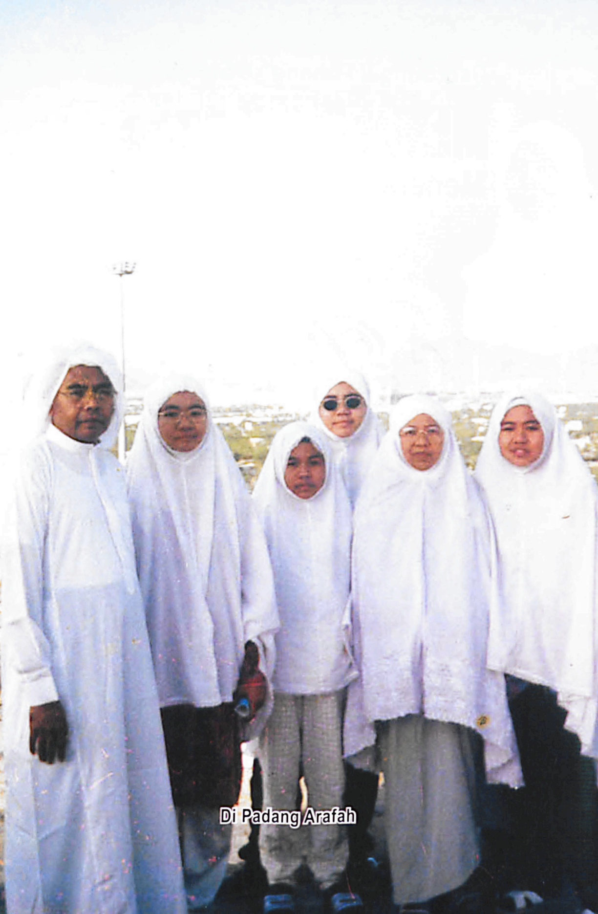
Di Padang Arafah