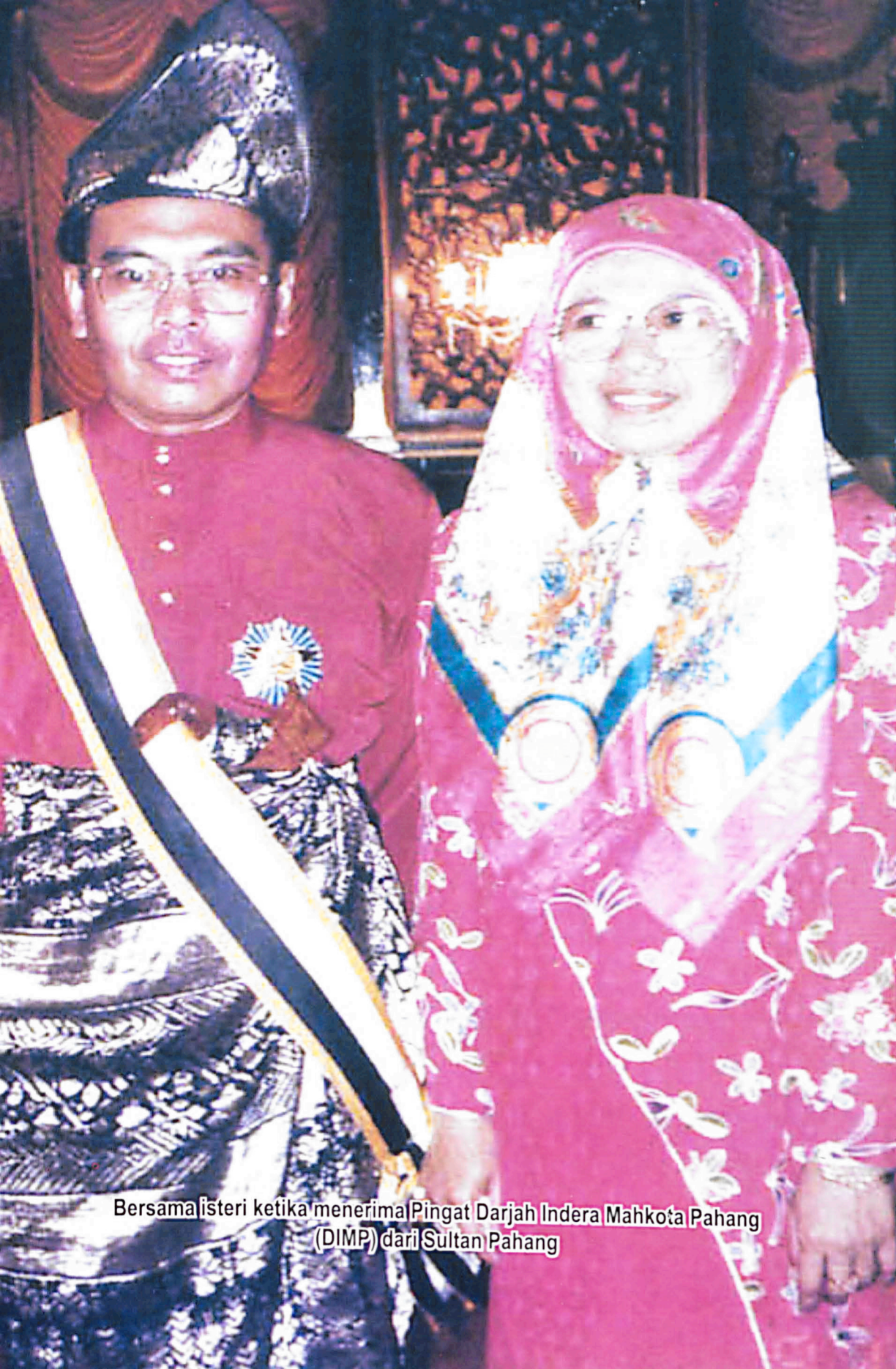
Bersama isteri ketika menerima Pingat Darjah Indera Mahkota Pahang (DIMP) dari Sultan Pahang