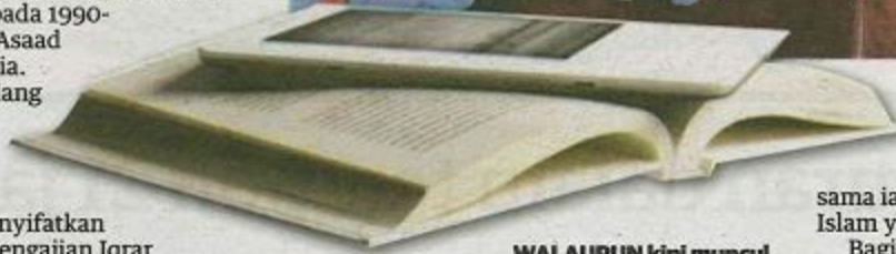
WALAU PUN kini muncul al-Quran dalam bentuk digital tetapi surahnya perlu selari dengan kehendak Rasm Uthmani .

Quran tidak boleh berubah dan perlu konsisten sehingga kiamat," katanya.