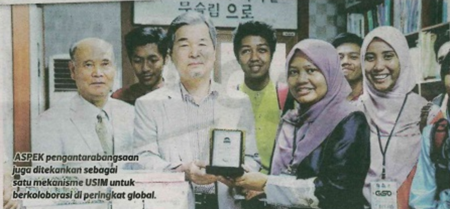
ASPEK pengantarabangsa juga ditekankan sebagai satu mekanisme USIM untuk berkolaborasi di peringkat global.