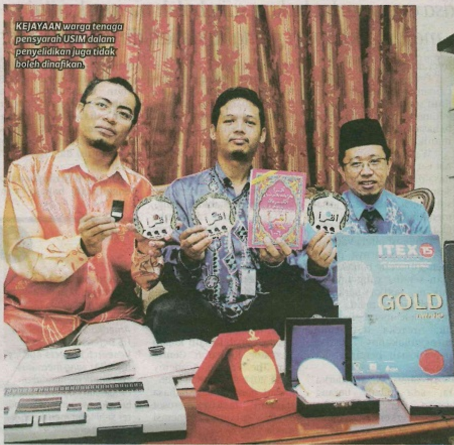
KEJAYAAN warga tenaga pensyarah USIM dalam penyelidikan juga tidak boleh dinafikan.

lahirkan bakal pemimpin yang seimbang menerusi integrasi Aqli dan Naqli," katanya.