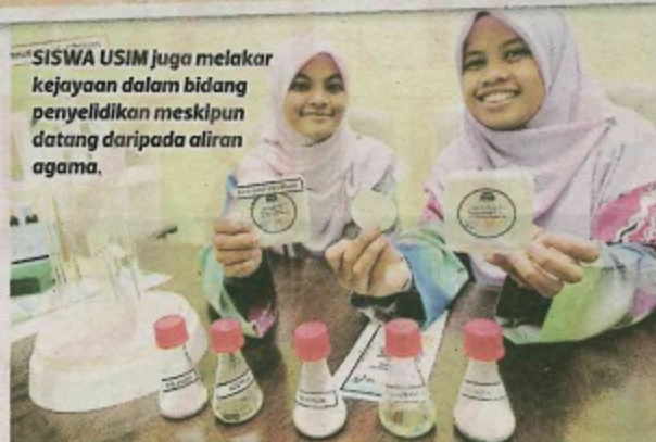
SISWA USIM juga melakar kejayaan dalam bidang penyelidikan meskipun datang daripada aliran agama.