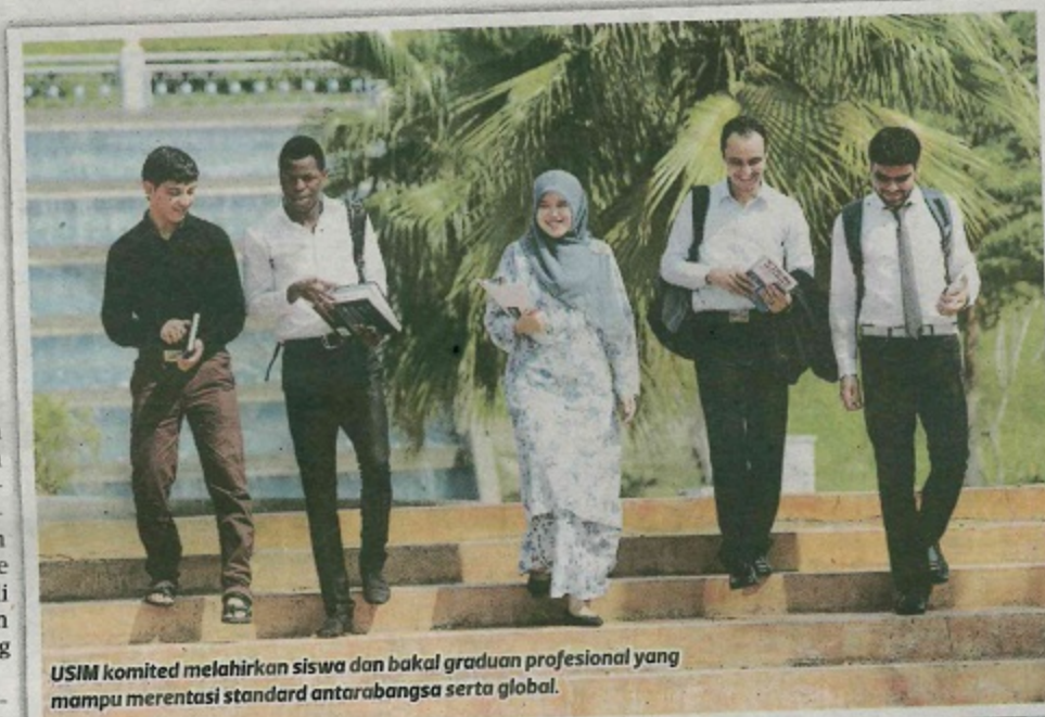
USIM komited melahirkan siswa dan bakal graduan profesional yang mampu merentasi standard antarabangsa serta global.

"Ini penting bagi memastikan USIM mampu membentuk dan me-