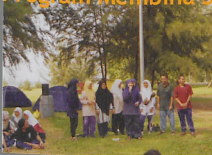
• Program membina semangat berpasukan pembimbing rakan universiti (PRU)

Program ini telah dianjurkan oleh Pembimbing Rakan Universiti (PRU) dengan kerjasama Unit Kaunseling Dan Pembangunan-Sahsiah. Ia telah diadakan pada 1 Januari 2003 di Camar Laut LKIM, Bagan Lalang, Sepang. Seramai 45 orang