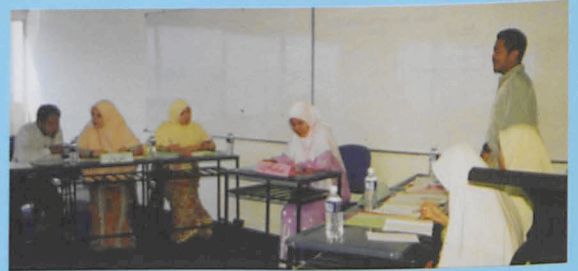
• Para peserta debat Bahasa Arab peringkat Universiti sedang rancak berdebat

Pertandingan Debat Bahasa Arab Peringkat Universiti merupakan program yang julung-julung kali diadakan bagi percubaan peringkat pertama. Pertandingan ini memperlihatkan KUIM sebagai perintis dalam usaha menguasai Bahasa Arab sebagai bahasa pengantar kedua di samping Bahasa Inggeris. Bertempat di Menara B, tarikh 13 Januari itu telah menyaksikan beberapa peserta dari pelbagai fakulti menyertai pertandingan tersebut. Ternyata cita-cita KUIM menjadikan bahasa Arab sebagai aset dalam memelopori sesebuah bidang hampir tercapai dengan terlaksananya debat dalam bahasa Arab ini. Kursus penghakiman turut diadakan bagi memberi taklimat berkaitan pertandingan yang telah diadakan. Sebanyak 7 penyertaan yang telah diterima dan pertandingan akan diadakan pada 7hb Julai 2003 yang akan dirasmikan oleh Y. Bhg. Prof. Dato' Dr. Abdul Shukor Bin Hj. Husin Rektor KUIM.