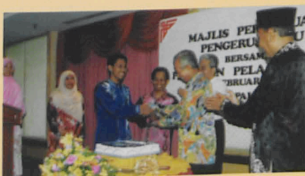
• Majlis pertemuan Pengerusi LPU bersama pemimpin pelajar

Pada 5 hb Februari lalu, bertempat di Hotel De Palma satu pertemuan di antara Y. Bhg. Tan Sri LPU bersama ahli MPP, JAKSA II & III serta wakil-wakil Kelab. Pada masa yang sama telah diadakan juga dialog antara pengurusan tertinggi dan pemimpin pelajar. Pertemuan tersebut telah dihadiri oleh