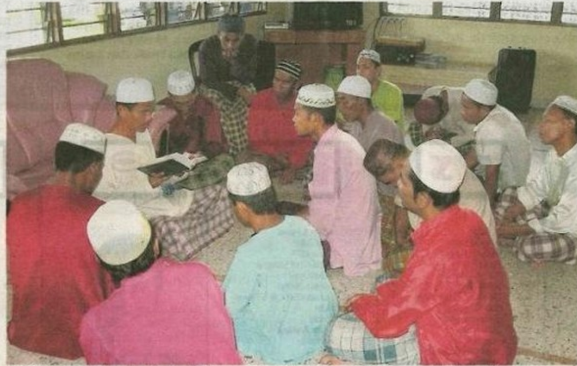
HANYA dengan kembali kepada ajaran agama Islam beserta dengan kesedaran diri mampu membawa para penagih ke pangkal jalan. - Gambar hiasan

Beliau berkata demikian dalam kertas kerja bertajuk Terapi Psikospiritual Islam dan Pengalaman Pusat Pemulihan Dadah Berteraskan Islam pada Seminar