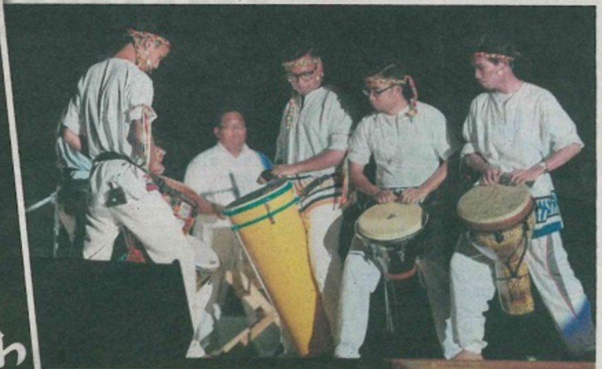
SENI persembahan artistik, inovatif dan kreatif turut bakal mewarnai Konsert Alhan Rabbaniyah.