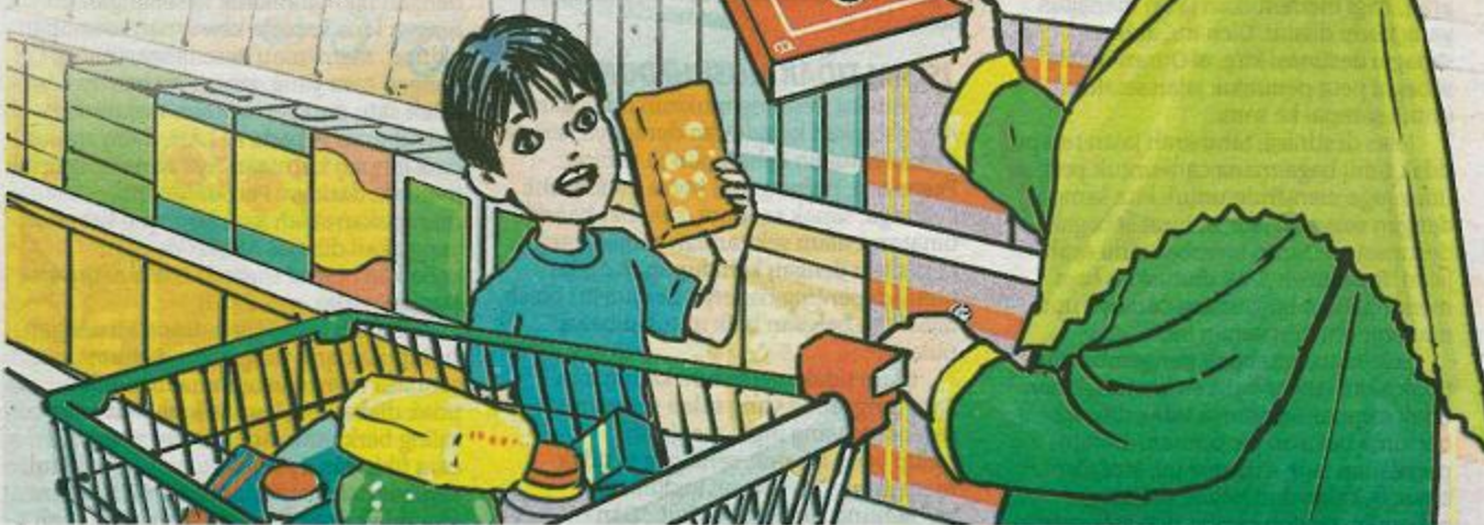
Setiap peniaga perlu mengetahui halal dan haram corak perniagaan yang dilakukan. - Ilustrasi Gayour

Aktiviti keusahawanan dan juga perniagaan sebenarnya menggalakkan kejujuran, saling bekerjasama dan juga semangat dalam kegigihan berusaha bersaing secara sihat menurut prinsip syariah. Ini kerana hasil daripada nilai-nilai inilah yang akan menyumbangkan kebajikan masyarakat khususnya membangunkan institusi zakat dan wakaf di negara ini.