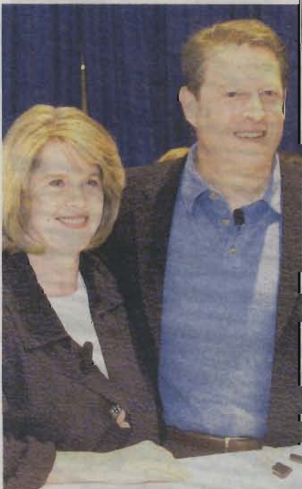
PASANGAN Al Gore dan isterinya, Tipper mengumumkan perpisahan setelah 40 tahun hidup bersama.

Kebanyakan kes perceraian pada usia emas berlaku apabila suami berkahwin lain dan menganiaya isteri yang menyebabkan isteri dicerai atau memohon cerai