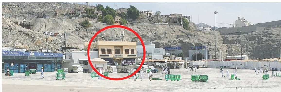
RUMAH kelahiran Nabi Muhammad SAW yang kini dijadikan perpustakaan.

kerana kebenaran telah jelas nyata. Allah akan menghimpunkan kita bersama pada hari kiamat dan kepadaNya lah tempat kembali semuanya untuk dihakimi dan diberi balasan. (Syura: 15)