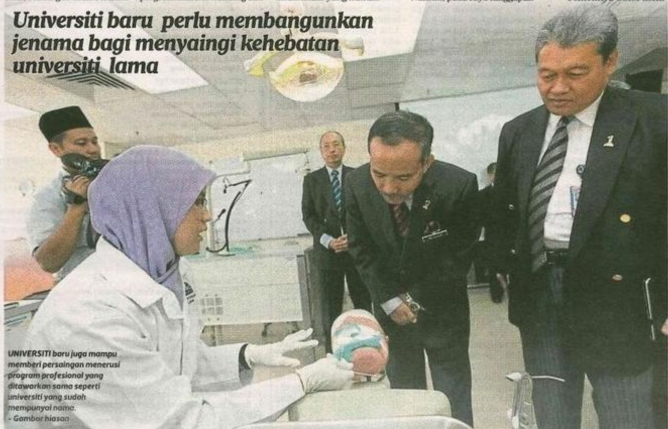
UNIVERSITI baru juga mampu memberi persaingan menerusi program profesional yang ditawarkan sama seperti universiti yang sudah mempunyai nama. - Gambar hiasan