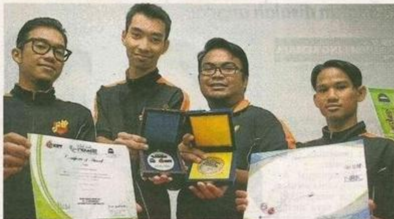
KEJAYAAN mahasiswa universiti baru juga sering menjadi perhatian masyarakat kerana ingin mengetahui sejauh mana kemampuan mereka memberikan persaingan. - Gambar hiasan

Mengambil contoh USIM, beliau optimis penawaran program adalah setanding dan