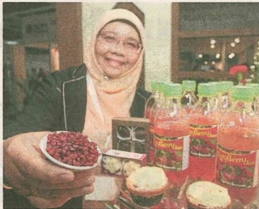
MEMANG tidak dinafikan universiti lama mempunyai kepakaran tinggi dan diiktiraf dalam bidang penyelidikan namun tidak musta universiti baru juga mampu melakar sejarah serupa. - Gambar hiasan

“Jadi, kekuatan dan kelebihan institusi baru diselaraskan dengan peranan masing-masing dan pada masa sama menyokong kehendak aspirasi pendidikan tinggi negara,” katanya.