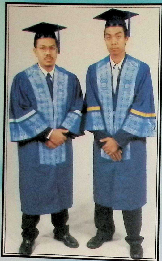
Kiri : Jubah Graduan Fakulti Ekonomi dan Muamalat Left : Robe for Faculty of Economics and Muamalat Graduates جبّة الخريجين لكلية الإقتصاد والمعاملات: يسار