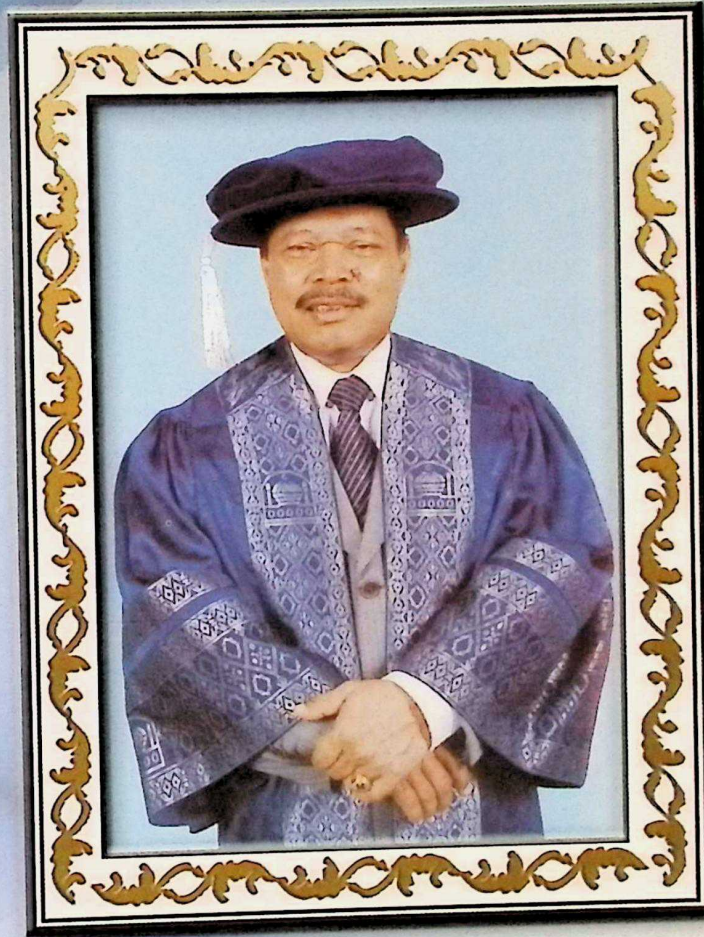
صاحب المعالي تان سري داتوء سري موسى بن محمد YANG BERTHORMAT TAN SRI DATO' SERI MUSA BIN MOHAMAD PSM, DPSM, DMPN, JSM, PKT. B.Pharm (S'pore), MSc (London), DSc Hon (USM)

MENTERI PENDIDIKANI / MINISTER OF EDUCATION / وزير التربية