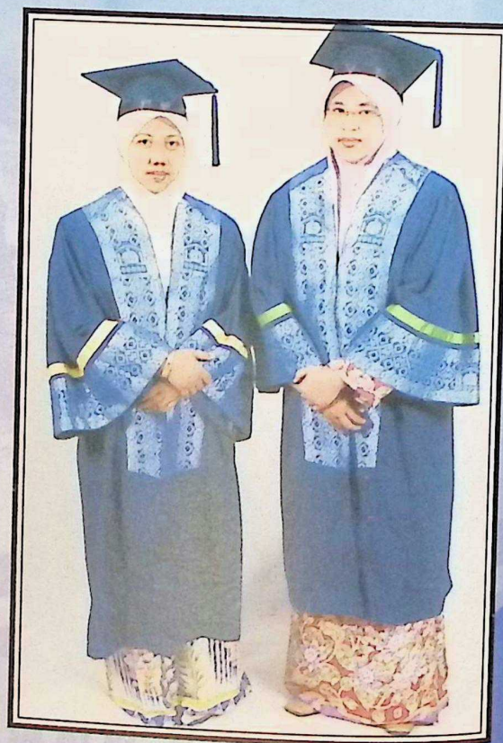
Kanan : Jubah Graduan Fakulti Pengajian Quran dan Sunnah Right : Robe for Faculty of Quranic and Sunnah Studies Graduates جبّة الخريجين لكلية دراسات القرآن والسنة: يمين