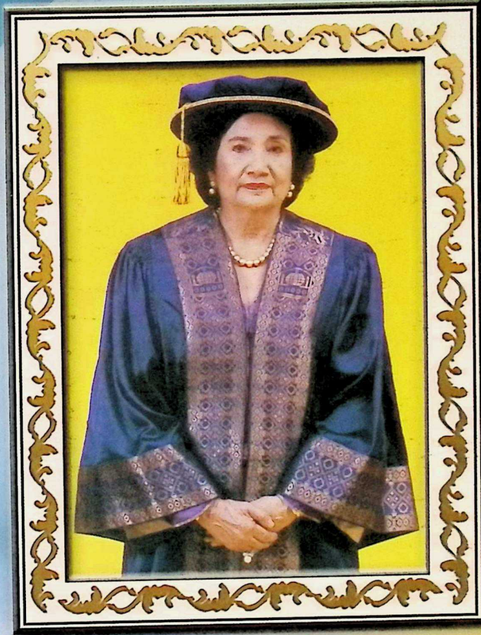
صاحبة الجلالة الملكة نجيها بنت المرحوم تنكو بسر برهان الدين DULI YANG MAHA MULIA TUANKU NAJIHAH BINTI ALMARHUM TUNKU BESAR BURHANUDDIN. D.K.N.S, D.M.N., D.K. (Kedah), D.K. (Kelantan) S.P.T.J., S.P.M.K. Tunku Ampuan Negeri Sembilan

المستشارة الملكية للجامعة / CANSELOR / CHANCELLOR