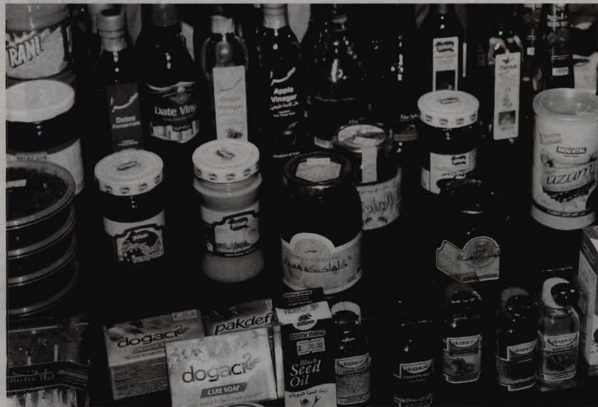
BERHATI-HATI memilih makanan elak diri tertipu dengan logo halal digunakan.

musuh yang terang nyata bagi kamu.” (Surah al-Baqarah, ayat 168)