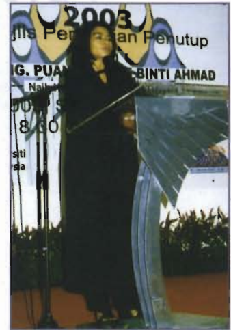
Y. Bhg. Puan Noraini Ahmad berucap ketika merasmikan Majlis Penutup Festival Busana Islam MAKUM.

Secara keseluruhannya, festival ini telah berjaya menarik ramai pengunjung untuk mencuba pelbagai fesyen terbaru busana Islam yang berada di pasaran sekarang. Selain itu, secara tidak langsung, sedikit sebanyak ia juga telah memperkenalkan KUIM sebagai salah sebuah institusi pengajian tinggi awam yang baru di Malaysia.