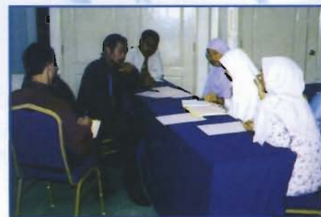
Para peserta kursus mengadakan gerak kerja dan perbincangan dalam kumpulan.

Kursus Latihan ini merupakan satu siri latihan yang harus dilalui oleh setiap Ahli Jawatankuasa MPP dan wakil dari badan-badan pelajar yang lain yang baru dilantik. Mereka perlu diberi pendedahan awal tentang pengurusan persatuan serta peranan mereka dalam mengendalikan sesuatu program. Selain itu, mereka juga berpeluang mengikuti ceramah kepimpinan daripada tokoh-tokoh pemimpin yang diundang khas bagi membuka minda tentang dunia kepemimpinan Islam sebagai teladan dari aplikasi dalam memikul tanggungjawab sebagai pemimpin pelajar.