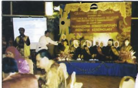
Pelajar-pelajar mempersembahkan dikir barat pada malam tersebut