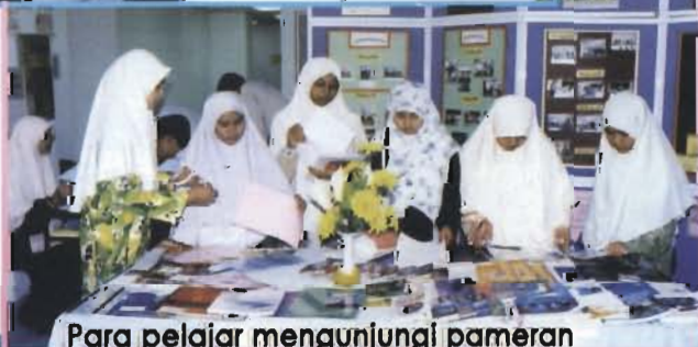
Para pelajar mengunjungi pameran buku yang juga disediakan ketika pameran PRU