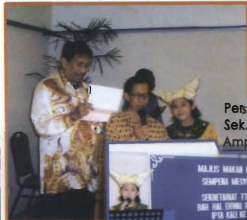
Persembahan Caklempong Sek. Ren. King George Ke - V Ampangan Negeri Sembilan