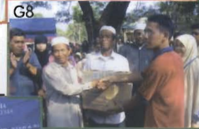
G7 - Majlis Dialog pelajar Kemboja G8 - Majlis Simbolik Penyerahan G9 - Penyembelihan & Aqiqah