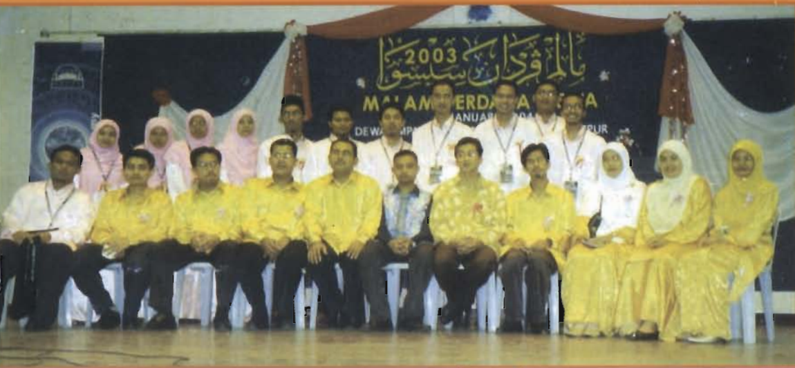
Sekitar Malam Perdana Siswa Anjuran JAKSA RIVIERA 2