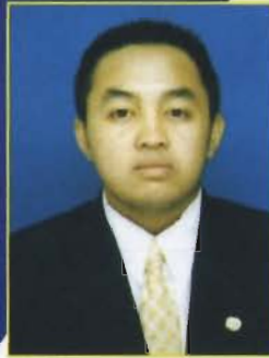
Agama di Ranau, Sabah.