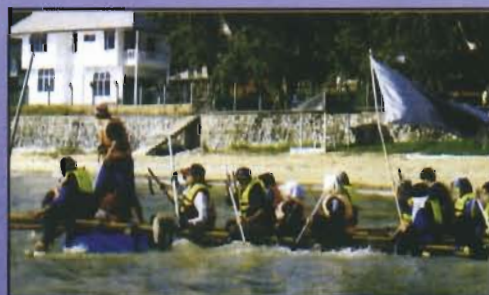
Para peserta berakit secara berkumpulan

Semua program tersebut telah dirancang dengan teliti bertujuan untuk menanamkan sifat berani, keyakinan diri dan berdikari yang tinggi kepada Urusetia Sukan & Rekreasi tanpa membelakangkan semangat berpasukan yang diakui dapat menjayakan segala aktiviti yang dirancang. Dari sudut ilmiah pula, mereka telah melalui kelas bimbingan Bahasa Arab dan Bahasa Inggeris khusus untuk mempertingkatkan kemahiran komunikasi yang dikendalikan oleh para pensyarah dari Unit Bahasa yang berkenaan. >>>